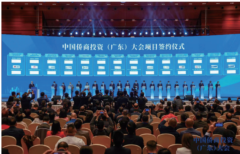
▲中国侨商投资（广东）大会在广州召开

要坚决贯彻习近平总书记和党中央决策部署，落实第十一次全国归侨侨眷代表大会确定的各项任务，全面履行职能，深化侨联改革，坚持“两个并重”“两个拓展”“两个建设”，织好“两张网”、构建“两项机制”，围绕中心、服务大局、服务侨胞，把广大归侨侨眷和海外侨胞紧密团结在党的周围，为强国建设、民族复兴作出新的更大贡献。