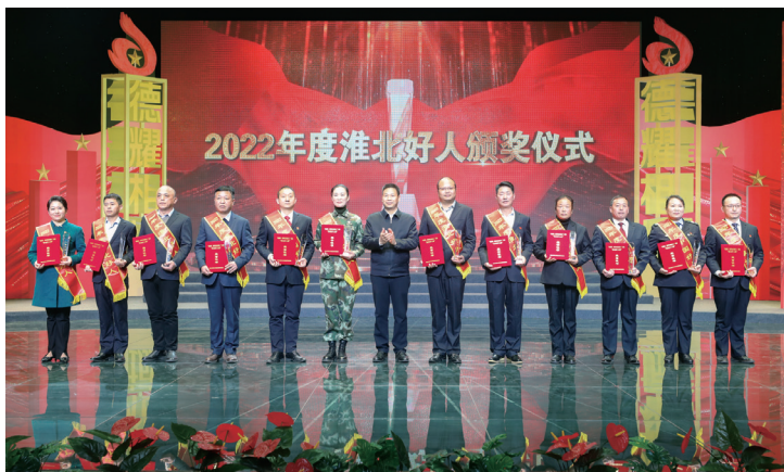
▲2022年度淮北市道德模范与身边好人现场交流活动

旗帜鲜明树导向。淮北市高度重视思想道德建设，市委常委会每年学习研究习近平总书记关于精神文明建设和思想道德建设的重要论述，将身边好人等先进典型学习宣传纳入党委综合考核、意识形态巡察等内容，考核结果与评先评优挂钩。各县区、市直有关单位结合实际，精心设计并组织开展各类实践，构建上下联动、步调一致的公民思想道德建设工作格局。在工作中，注重发挥新时代文明实践中心（所、站）、“学习强国”学习平台作用，坚持不懈用习近平新时代中国特色社会主义思想凝心铸魂，持续深化“四史”宣传教育，广泛组织开展“永远跟党走”“强国复兴有我”等主题宣传教育，激励广