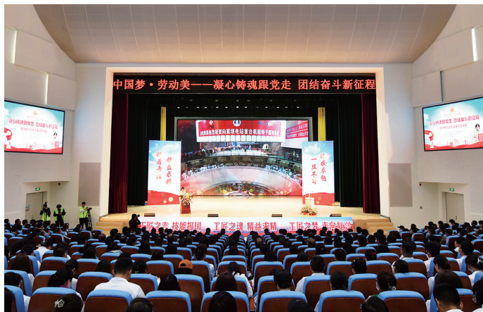
▲中国电建举办学习“大国工匠”先进事迹报告会

中国电建党委坚持以习近平新时代中国特色社会主义思想凝心铸魂，抓好党的创新理论学习及宣传阐释，教育引导广大干部职工不断增进对党的创新理论的政治认同、思想认同、理论认同、情感认同。一是坚持体系化全面系统学。以主题教育为契机，扎实读原著学原文悟原理，通过读书班、联学会等多种形式，原原本本学习《习近平著作选读》等指定书目，认真研读《论党的宣传思想工作》，系统梳理党的十八大以来与本企业本行业相关的3方面11个领域习近平总书记重要指示批示357项，编制习近平总书记关于碳达峰碳中和等重要论述专项摘编23个。按照“有没有学习研讨、有没有贯彻