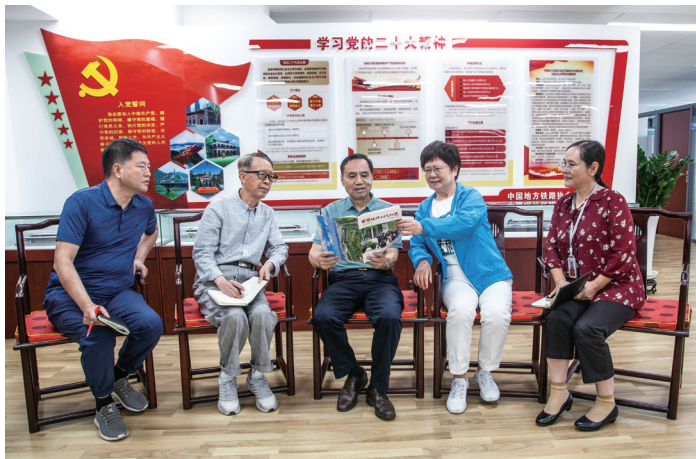
▲《今日铁路》编辑们认真学习《思想政治工作研究》

我压力很大。一是这方面的文章我过去写得少；二是这篇稿件涉及的时间跨度较长、内容繁多，无论是主题确定还是结构设置，难度都不小，一时无从下手。上百万字的材料看得我理不清头绪，弄得我头疼。如何写好政治类通讯？我突然想到《思想政治工作研究》。我知道这本杂志是我国思想政治工作领域的权威期刊，对政治工作研究深透，宣传报道有深度、有特点，可以学学里面这方面文章的写法。我找来十几本《思想政治工作研究》（当时单位未订阅），认真地翻看这类文章的写作技巧，包括文章主题、谋篇布局、主要观点等。经过一两天的学习研究，终于对这类文章的写法有了一个大致了解。为了更进一步掌握政治类通讯的写作方法，我又根据杂志上标明的编辑电话，就具体问题向编辑同志深入请教。一位编辑同志接了电话，他和蔼可亲地说，请问您是投稿吗？我说，不是，我想请教一个问题。接着，我就说了我面对的难题。那位编辑同志告诉我：写政治工作的大文章，要抓住重点，不要面面俱到。理论指导实践，我知道你们铁路的干