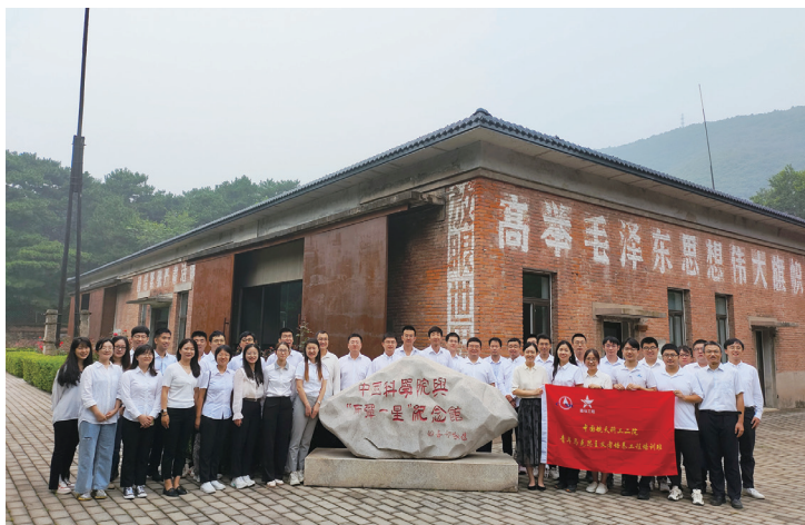
▲航天二院青马学员赴“两弹一星”纪念馆开展现场教学

航天二院坚持不懈用习近平新时代中国特色社会主义思想武装青年，不断提升青年“政治三力”，打造青年思想进步的“政治学校”。一是夯实理论根基，增强政治认同。以全面系统学、深入思考学、联系实际学、及时跟进学、岗位建功学的“五学联动”模式，兴起“青年大学习”热潮。建立“书记领学”品牌，党委书记带头讲、基层党支部书记跟进讲，扎实推动习近平新时代中国特色社会主义思想走进青年，专题授课316次，受众3.2万人次，引领青年深刻领会“两个确立”的决定性意义，增强“四个意识”、坚定“四个自信”、做到“两个维护”。二是建强教育阵地，补足精神之钙。针对青年职工经常长时间出差的特点，开设青年学堂、云课堂APP等，组织“云上读书班”“直播快问快答”线上学习。纵深推进“青年马克思主义者培养工程”，构建“三横六纵”培养体系，累计为668名青年政治骨干“凝心铸魂”。三是建立长效机制，常学细悟思想。制定青年学习教育实施方