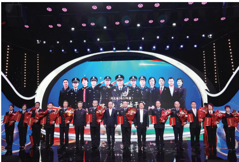
▲河北省举行“最美政法干警”发布仪式活动

习近平总书记对宣传思想文化工作作出了重要指示，强调“宣传思想文化工作面临新形势新任务，必须要有新气象新作为”。近年来，河北省委宣传部坚持围绕中心、服务大局，积极推动社会宣传工作，充分发挥了示范引领作用。当前以价值引领、氛围营造为主要任务的社会宣传工作面临着不断迭代升级的网络信息技术的冲击，从大处着眼、小处着手，探索谋划可操作性的数字化社会宣传平台显得尤为迫切和必要。