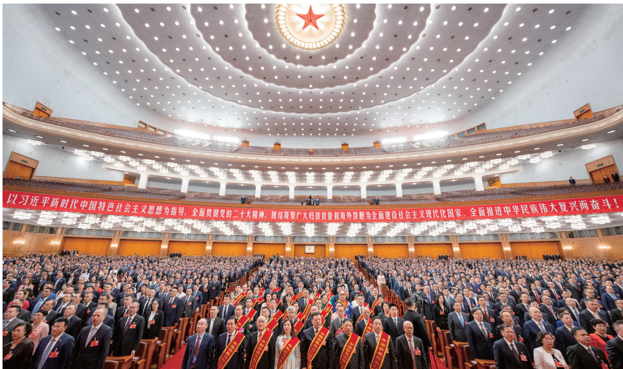
▲第十一次全国归侨侨眷代表大会在北京召开

在以习近平同志为核心的党中央坚强领导和亲切关怀下，第十一次全国归侨侨眷代表大会于2023年8月31日至9月3日在北京隆重召开。习近平总书记等党和国家领导人到会祝贺，充分体现了对广大归侨侨眷和海外侨胞的深厚感情与亲切关怀，充分体现了对侨联工作的高度重视和殷切期望。要坚持以习近平新时代中国特色社会主义思想为指导，全面贯彻党的二十大精神，深入贯彻习近平总书记关于侨务工作的重要论述，勇于担当、守正创新，团结凝聚广大归侨侨眷和海外侨胞，为全面建设社会主义现代化国家、全面推进中华民族伟大复兴而奋斗，为推动构建人类命运共同体作出积极贡献。