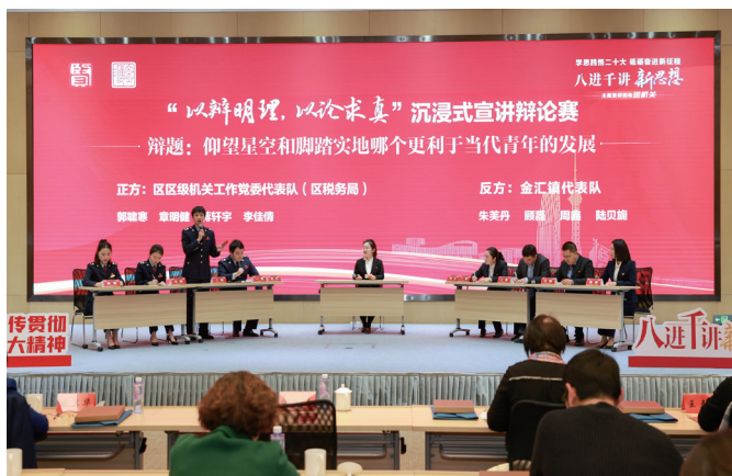
▲上海市奉贤区举办“八进千讲新思想”主题宣讲进机关活动

用好活用各类宣讲场所，“小阵地”奏响“大乐章”。以“群众在哪里，宣讲阵地就在哪里”为目