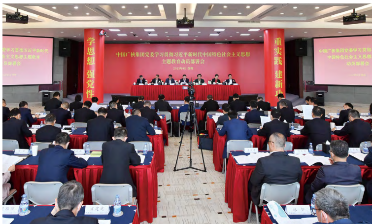
▲中广核召开学习贯彻习近平新时代中国特色社会主义思想主题教育动员部署会

落实主体责任。落实党中央《关于新时代加强和改进思想政治工作的意见》和国务院国资委党委《关于新时代加强和改进中央企业思想政治工作的实施意见》，中广核党委建立健全思想政治工作责