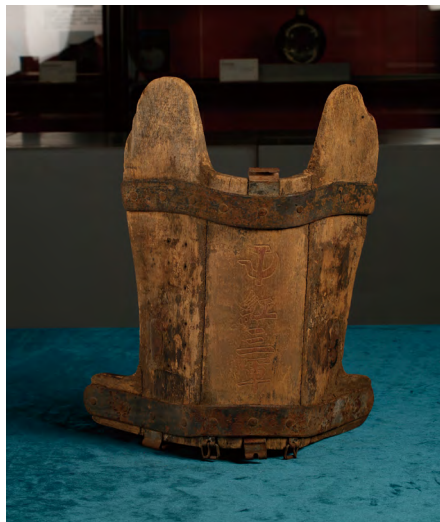
▲湖南大学正红馆收藏的红三军马鞍

一是加强对革命文物的故事挖掘，引导做好“读懂”的功夫。历史是最好的教科书，读懂教科书是最基础的环节。革命文物承载着党和人民英勇