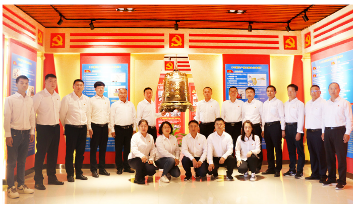
▲华电陕西公司纪委常态化开展警示教育

习近平总书记在全国国有企业党的建设工作会议上强调：“要把思想政治工作作为企业党组织一项经常性、基础性工作来抓。”华电陕西能源有限公司（以下简称“华电陕西公司”）党委在积极响应国家“双碳”目标、全面推进企业转型升级的过程中，认真学习贯彻落实习近平总书记关于思想政治工作的重要论述和重要指示批示精神，不断加强改进思想政治工作，为企业生产经营、改革发展注入了强劲的精神动力。