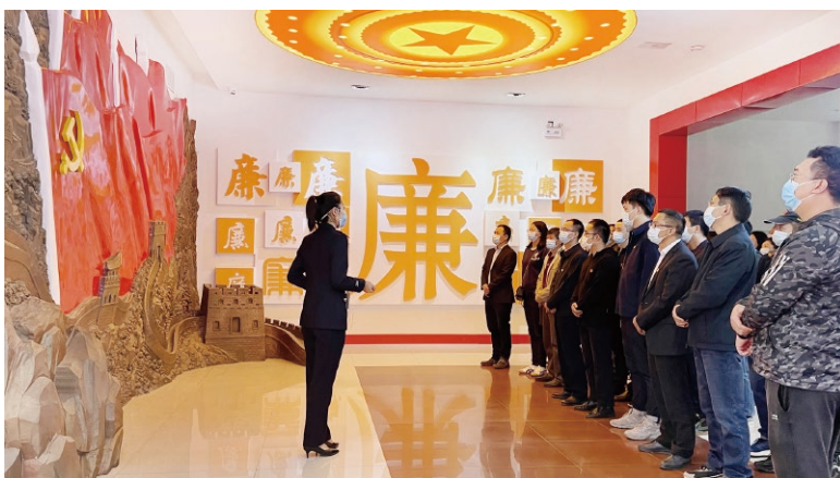
▲国家能源投资集团有限责任公司开展监督人员队伍建设活动

为探索国有企业监督工作的内在规律和实现路径,推进国有企业构建以党内监督为主导、各类监督协调贯通的监督体系,把监督有效融入公司治理,助推高质量发展,国家能源投资集团有限责任公司课题组在充分调研、交流的基础上,综合分析国有企业监督体系存在的现实问题,提出了“两委一会一层”(党委、监督委、董事会、经理层)监督体系架构,在领导体制上实现党对监督工作的全面领导,工作机制上实现各类监督贯通协同,制度设计上实现监督融入公司治理全过程。