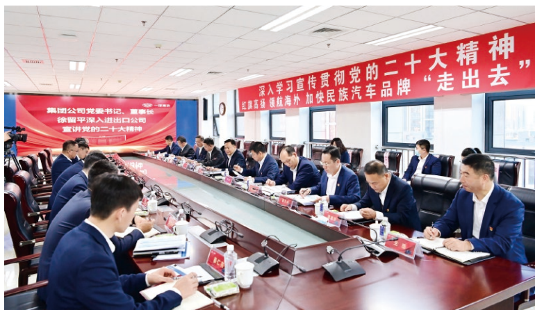
▲中国一汽党委班子成员带头深入基层宣讲党的二十大精神

么旗、走什么路、以什么样的精神状态、朝着什么样的目标继续前进的重大问题。思想政治工作要以更加强烈的历史主动精神，更好地承担起举旗帜、聚民心、育新人、兴文化、展形象的使命任务。中国一汽把学习宣传贯彻党的二十大精神和深入贯彻落实习近平总书记视察一汽重要讲话精神贯通起来，把统一思想共识和提振精神文化结合起来，引领全体党员干部、员工高举中国特色社会主义伟大旗帜，自信自强、守正创新，踔厉奋发、勇毅前行，以实际行动把党的二十大精神落到实处。