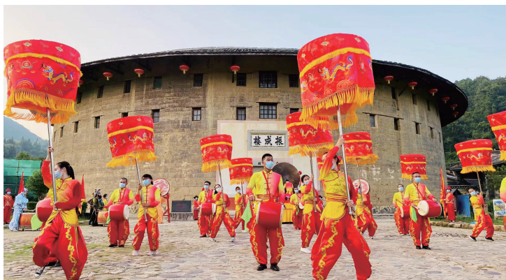
▲客家民俗“大鼓凉伞舞”在永定土楼景区演出

习近平总书记指出：“深入挖掘中华优秀传统文化蕴含的思想观念、人文精神、道德规范，结合时代要求继承创新，让中华文化展现出永久魅力和时代风采。”福建省龙岩市永定区立足丰富的红色文化、土楼文化、客家文化、侨台文化和生态文化优势，发挥乡村优秀传统文化在凝聚人心、引导村民、淳化民风中的作用，以“六化”推动乡村文化振兴发展。