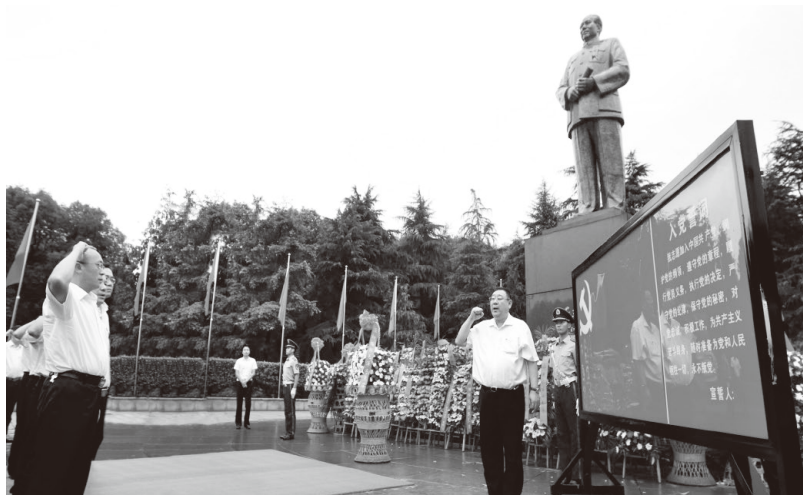
▲国网湖南省电力公司党委在韶山毛泽东铜像广场重温入党誓词

建立协同机制，做到“内外”联动。加强内部工作协同，统筹党务、人事和综合部门联动开展工作，发挥工作合力。通过“联学联创”载体组织各直属单位和市州供电公司