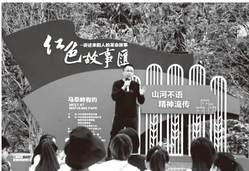
▲衡阳耒阳市举办周末有约马阜岭红色故事汇