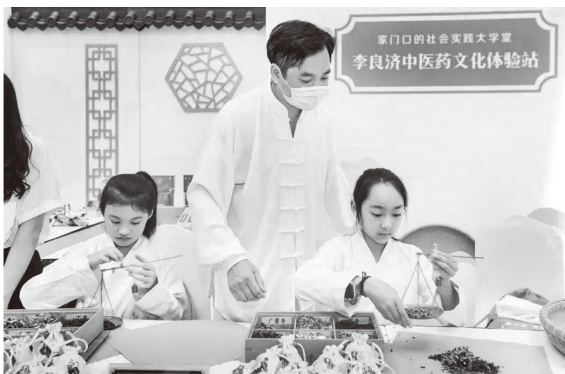
▲“家门口的社会实践大学堂”互动体验区代表项目展示

1. 建立苏州市未成年人健康成长指导中心，服务未成年人心理健康教育。中心下设苏老师工作室、维权工作室、名师工作室、宣传培训工作室，为未成年人和家长提供心理健康教育宣传和专业咨询辅导等公益服务；配合全市中小学开展心理健康教育及师资培训等工作；宣传心理健康知识，举办