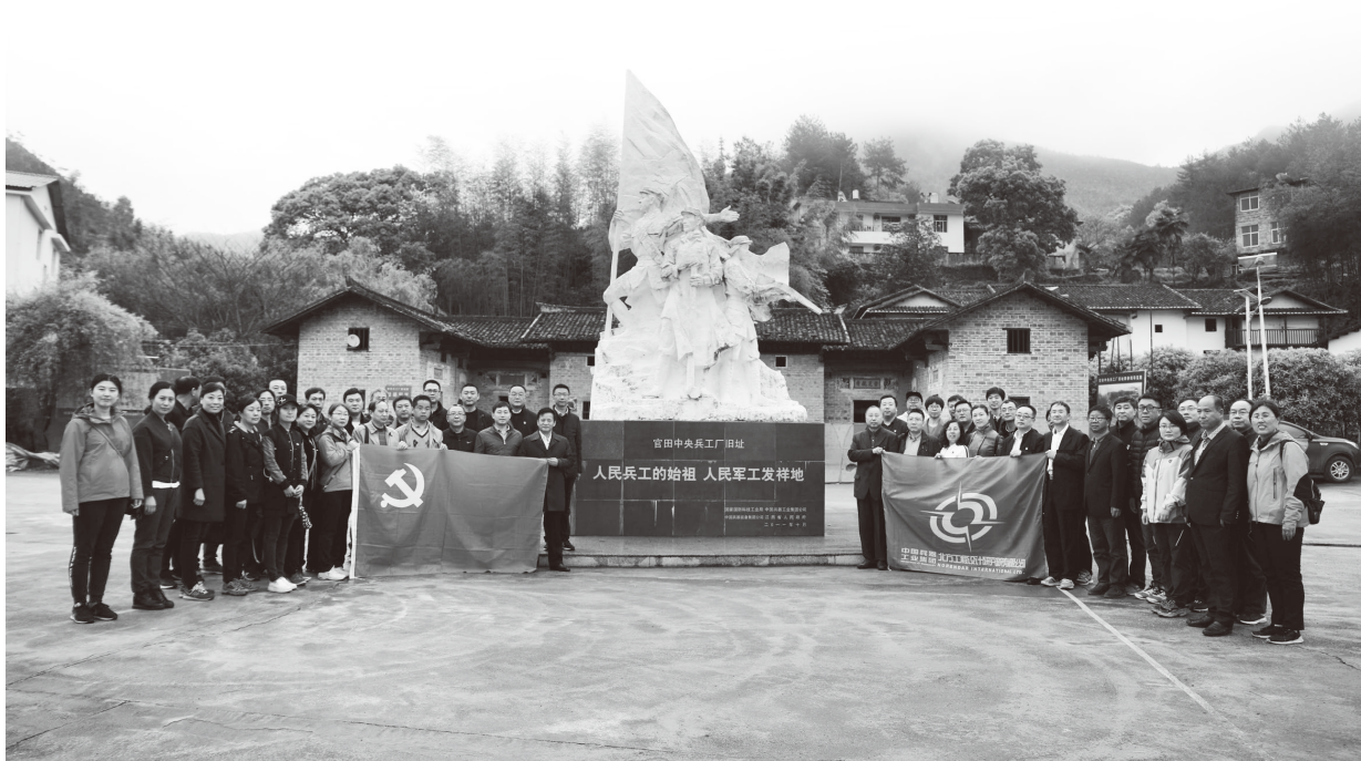
▲中国兵器北方设计院党员到江西官田中央兵工厂旧址开展党日活动

人民兵工是我们党领导和创建的第一个军事工业部门，1931年10月发端于星火燎原的中央革命苏区，成长于艰苦卓绝的敌后抗日烽火和波澜壮阔的人民解放战争岁月，壮大在新中国成立以来的建设和改革开放时期。在90年的光辉奋斗历程中，形成并秉承“把一切献给党”的人民兵工精神，坚定不移听党话、跟党走，为缔造和捍卫人民共和国、为新中国国防现代化建设和国防科技工业发展、为改革开放和中国