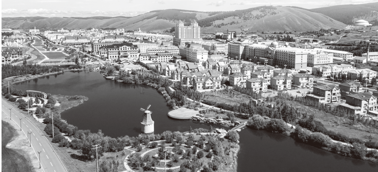
▲风景秀美的阿尔山市

兴安盟是内蒙古自治区政府的诞生地，几年前还是一个“少边穷”的地区，今天是如何实现华丽转身、走上全面小康之路？