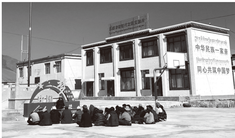
▲专家向群众讲解致富技术