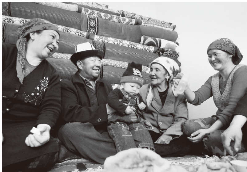
▲乌恰县牧民的幸福生活

新疆克孜勒苏柯尔克孜自治州地处祖国最西端，位于帕米尔高原东部、塔里木盆地西北边缘，是全国“三区三州”深度贫困重点区域。为了摆脱贫困，克州对居住在“一方水土养不起一方人”地方的牧民群众实施定居兴牧和易地搬迁，通过发展产业、扩大就业、创业帮扶、社会保障等措施，使搬迁群众搬得出、稳得住、能致富，共帮助28883户、11.55万牧民走出大山，实现了脱贫奔小康。