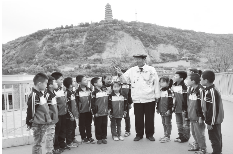
▲老党员为青少年讲延安精神

二是用心用情完善教程。针对“小小讲解员”好奇心强、记忆快等特点，把孩子的年龄特点和故事的趣味性相结