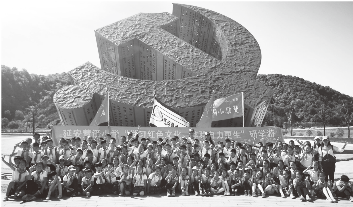
▲慧泽小学在南泥湾开展“红色研学”活动