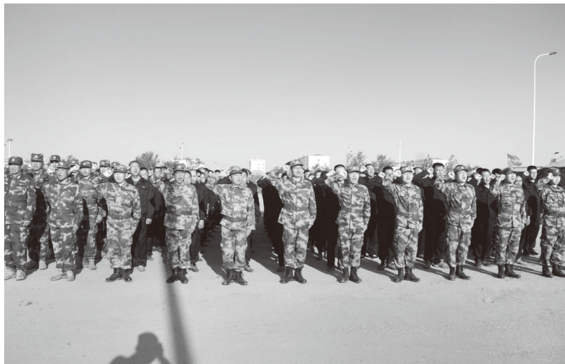
▲在庆祝建军90周年阅兵保障中，由兵器工业集团牵头的技术服务大队举行重温入党誓词活动

彰显大国重器顶梁柱作用。面对突如其来的新冠肺炎疫情，兵器工业集团干部职工听党号令、迎难而上，领导干部指挥在前线、共产党员冲锋在火线、党旗高高飘扬在一线，选派医护人员逆行出征驰援武汉，相关企业