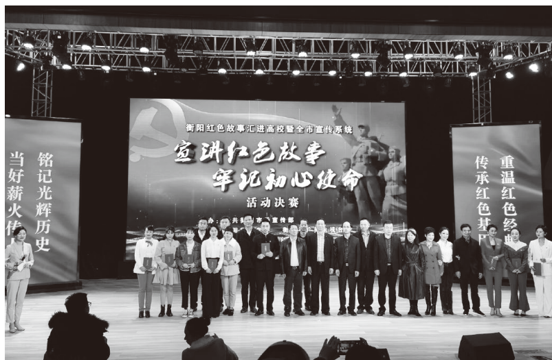
▲衡阳市宣传系统“宣讲红色故事 牢记初心使命”活动决赛

衡阳市坚持尊重历史、保护文化，全面挖掘梳理衡阳红色文化相关内容，深入开展理论研究和学术交流研讨活动，有效激活散落在衡湘大地的红色资源。一是深入调研摸清家底。先后围绕抗战资源开发、红色遗迹保护、红色资源开发、红色旅游发展等主题深入