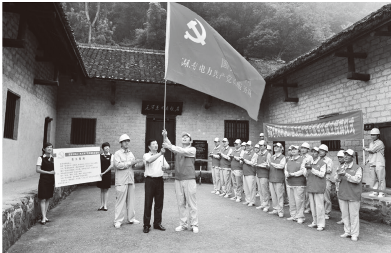
▲国网湖南电力东方红共产党员服务队在伟人故里韶山开展授旗仪式