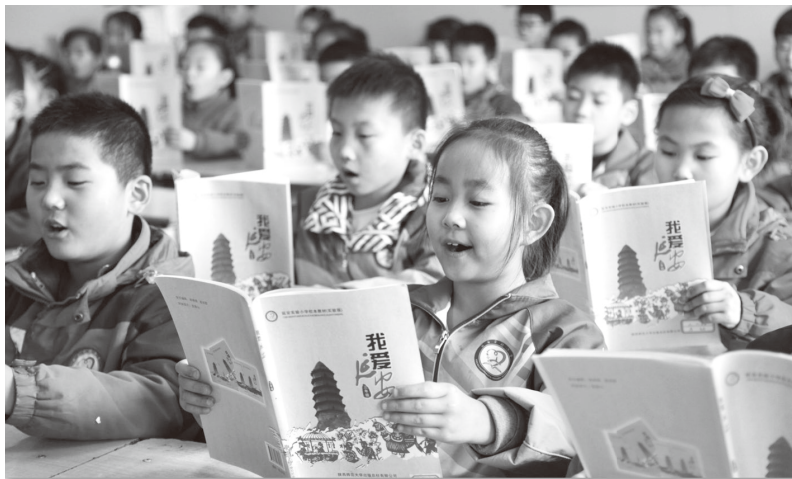
▲开展“弘扬延安精神 传承红色基因”阅读活动