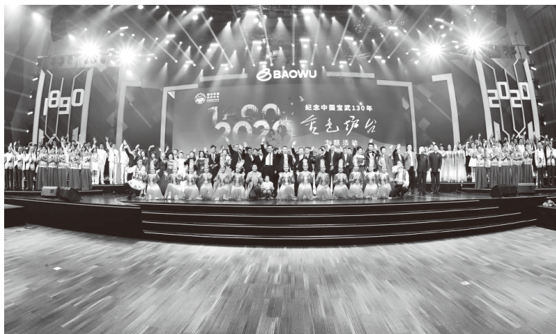
▲举办“金色炉台”主题活动

回顾党的历史，红色始终是党领导人民开展革命斗争的精神写照。回首中国宝武的130年，红色同样是钢铁初心的鲜明底色。1890年，江南制造局炼钢厂和汉阳铁厂相继在上海和武汉诞生。1938年，为免遭