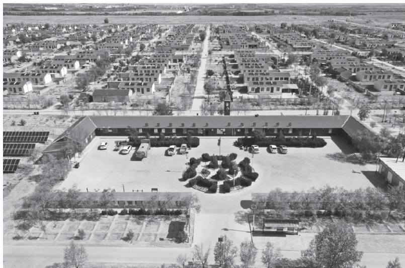
▲红寺堡区移民新村

因地制宜兴产业，精准发力找出路。弘德村共有1699户、7013人。刚搬迁过来时，由于村里土地不多，每户每人只分到