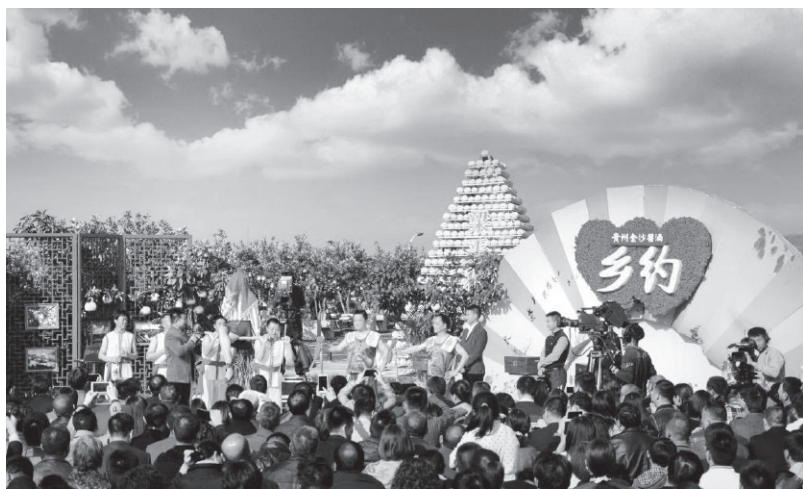
▲村民举办柚子节，中央电视台《相约》栏目组在龙滩村取景拍摄

养，推动乡村振兴外在塑形、内在铸魂，实现了生活富起来、环境美起来、精神强起来的小康梦。