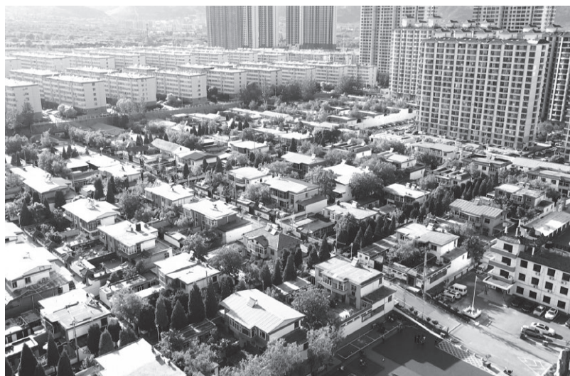
▲改革开放以后的九院村新貌

40多年前的九院村是一个典型的穷村，老百姓住的是破窑洞、吃的是返销粮，是远近闻名的“光棍村”。改革开放的春风对这个山西的小村落同样产生了深远影响。除了赶上农村家庭承包、分田到户的政策红利外，九院人更是紧紧抓住了山西煤炭工