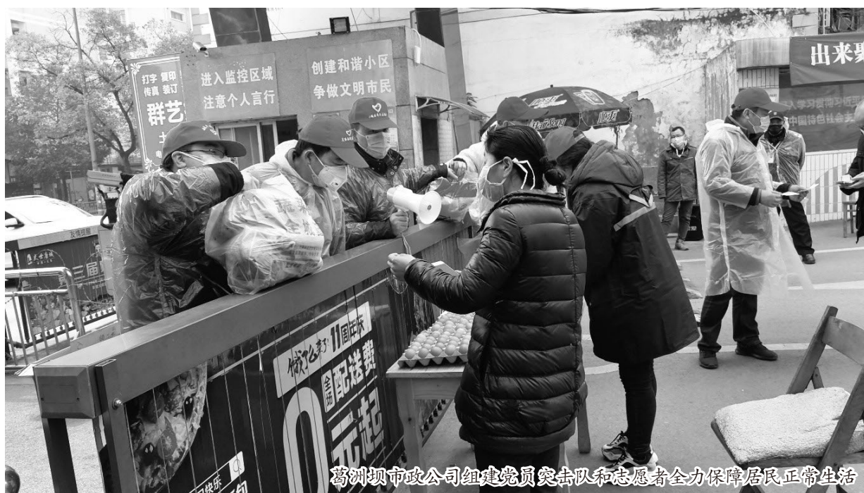
葛洲坝市政公司组建党员突击队和志愿者全力保障居民正常生活