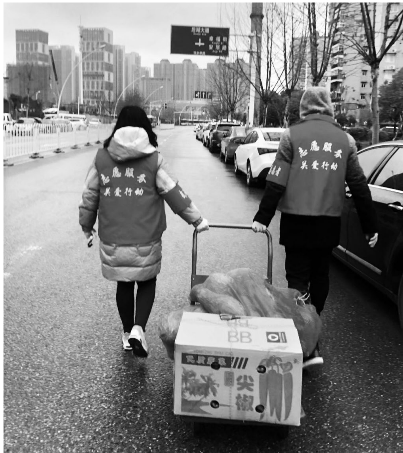
▲青年志愿者正在将居民提前团购的蔬菜分发并送到居民家门口

疫情防控志愿服务坚持让青年志愿者下沉基层一线，在街道社区、商超门店、方舱医院、物资仓储等地方开展服务，真正熟悉党和政府的政策措施，了解疫情防控中的社情民意，掌握来自服务岗位的各类知识，在急难险重任务中磨炼意志、积淀阅历；坚持发挥他们知识型、专业化的特长优势，安排他们担当心理疏导员、程序设计员、家电维修员等角色，把他们的兴趣特长转化成基层和群众需要的服务项目，把课堂上的专业知识转化为实践中的处事能力，用他们