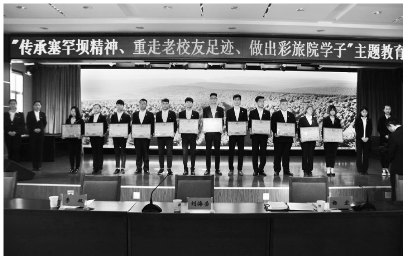
▲学院为弘扬塞罕坝精神“两红两优”活动先进代表颁奖