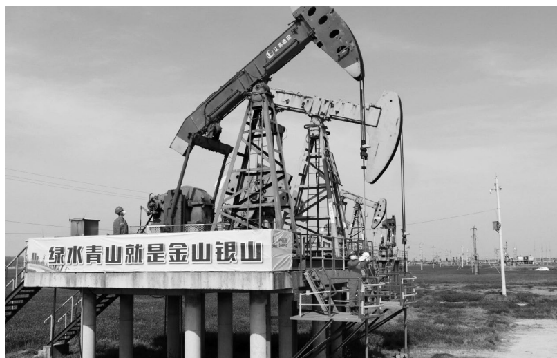
▲工点上竖立关于绿色发展的标语牌