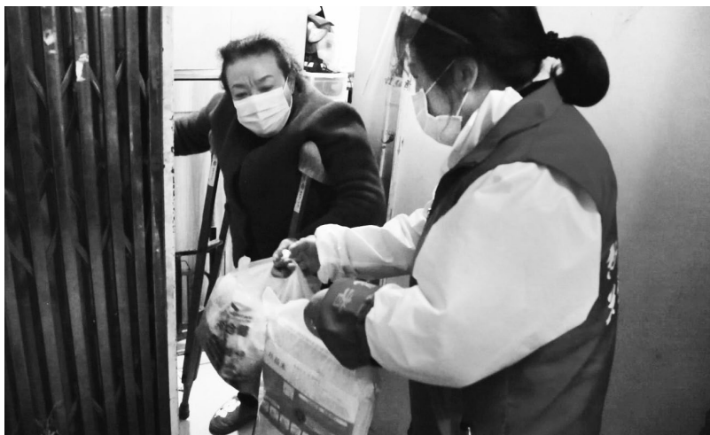
▲武汉社区志愿者为残疾居民送去爱心物资

专项行动注重激发武汉人民深厚的家国情怀、家园情感、英雄情结、守望情谊，引导他们积极有序参与志愿服务活动，大力弘扬雷锋精神、志愿精神，自觉践行社会主义核心价值观。一方面，通过打通生活物资配送到社区群众家中的“最后一公里”“最后一百米”，把党和政府关心群众、服务群众的暖心之举落