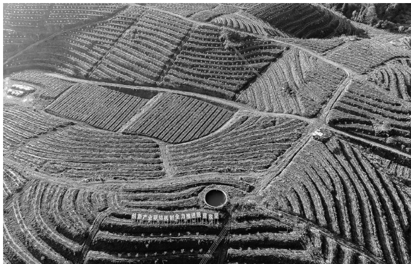
▲寻乌县葛蒲乡虎石村蓝莓扶贫产业基地

间文艺团体，组建村（社区）85支广场舞队。组织文艺工作者创作赣南采茶小戏《糊涂的村主任》、小品《精准到家》《懒汉脱贫》等一批富有泥土气息的脱贫攻坚题材作品，深受群众欢迎。三是以文化人激发内生动力。依托新时代文明实践中心（所、站），积极开展送戏下乡、“客家老表”春晚、广场舞大赛、“草根”书画培训等文化惠民活动。深入开展“我的脱贫故事”宣讲、“机关干部下基层，连心连情促脱贫”等活动，组织外出乡贤及原籍干部回乡举办脱贫攻坚成果宣讲会，与家乡人谈变化谋建设感党恩。持续开展“脱贫示范户”“脱贫红旗