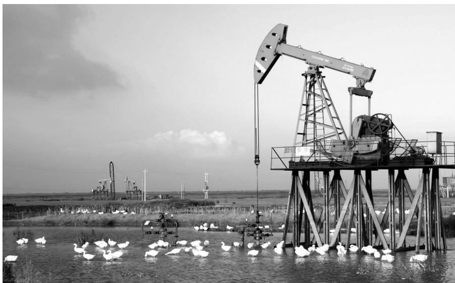
▲江苏油田推进绿色低碳发展战略，实现了环境保护与生产经营协调发展

过去，我到过不少油田采访和调研。在我的印象中，油区往往是河水浑浊、土壤污染、庄稼枯黄，而江苏油田是如何做到水秀田绿的？