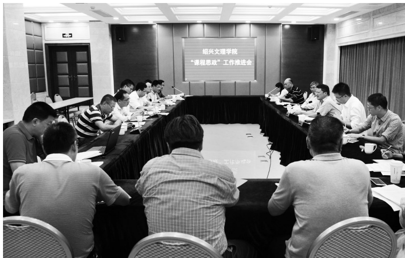
▲绍兴文理学院召开“课程思政”工作推进会

凝聚合力汇资源。各高校邀请专家名师指导制定完善了疫情防控专题“课程思政”教学实施方案,汇编了《新冠肺炎疫情防控期间“课程思政”参考资料》,充分利用在绍高校现有的