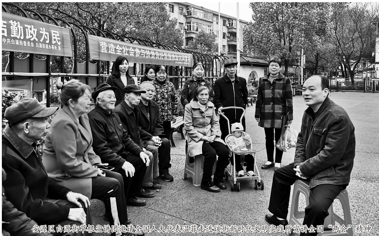
安源区白源街草根宣讲团邀请全国人大代表温菲走进该街新时代文明实践所宣讲全国“两会”精神