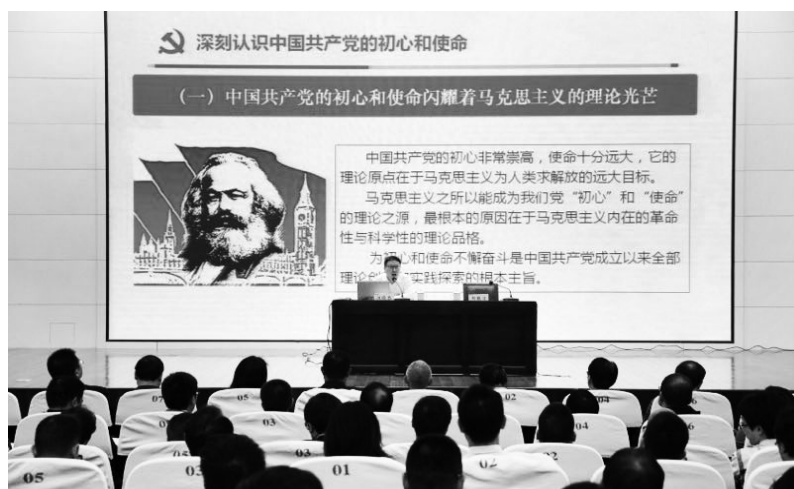
▲绍兴文理学院“不忘初心、牢记使命”主题教育专题党课

及时联动，加强谋划指导。绍兴市委宣传部联合市教育局发布了《关于新冠肺炎疫情防控期间深化“课程思政”工作的通知》，引导号召各在绍高校充分认识“课程思政”工作在凝聚共识、坚定信心、统一行动中的重要作用和独特作用，坚持化危为