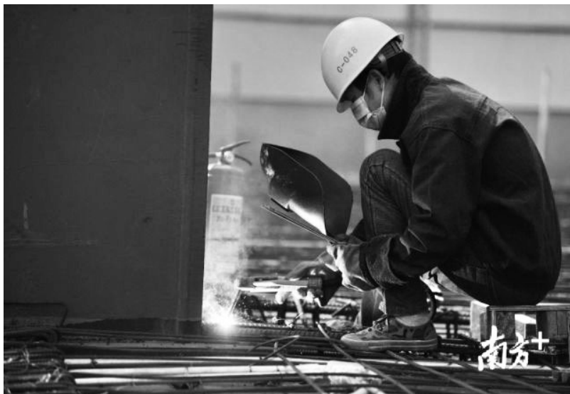
▲志愿服务摄影：佛山市南海区“最美生产一线人”

进事迹面向社会宣传推广，能够产生非常好的社会导向，激励人们同心协力、稳住经济、战胜疫情、创造美好生活。