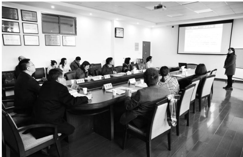
▲绍兴文理学院“课程思政”说课比赛

因材施教创特色。各高校将“课程思政”理念充分融入各校人才培养方案的修订中,积极构建重点突出、特色鲜明的人才培养体系。绍兴文理学院积极探索书院制育人模式改革与创新,浙江越秀外国语学院积极打造越秀义工校园文化品牌,浙江工业大学之江学院积极倡导360导学管家模式,绍兴文理学院元培学院积极创建校园红色学府,浙江农业商贸职