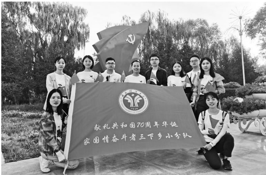
▲西南政法大学组织“三下乡”团队赴西北开展采访活动，聆听共和国奋斗者的心声，感受新中国的巨大变化

3. 坚持情感与情怀并重，努力做到“以情动人”。一方面，要联通“心心相印”的情感共鸣。人非草木，孰能无情。高校思想政治工作应