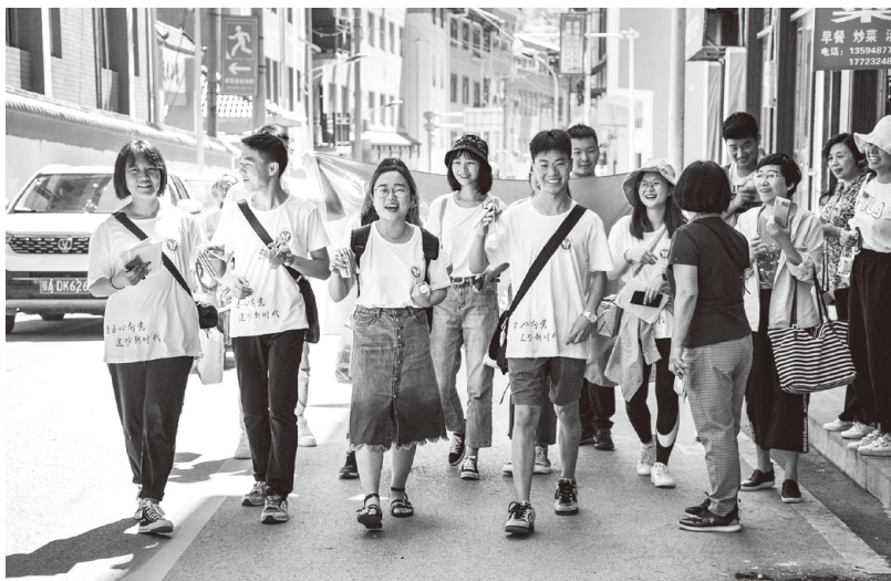
▲西南政法大学师生在重庆巫溪县天元乡开展思政课社会实践活动

党的十八大以来，以习近平同志为核心的党中央站在新的历史方位，就高校思想政治工作作出系列重大决策部署。习近平总书记亲自把脉定向，先后在全国高校思想政治工作会议、全国教育大会和学校思想政治理论课教师座谈会上发表重要讲话，为新时代高校思想政治工作指明了方向、提供了遵循。我们要深入学习贯彻习近平总书记关于高校思想政治工作的重要论述，坚持守正创新、固本铸魂，努力开创高校思想政治工作新局面。