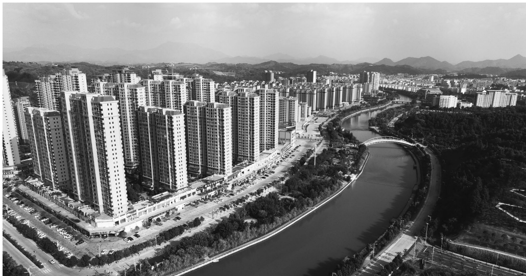
◀ 寻乌 县城新貌