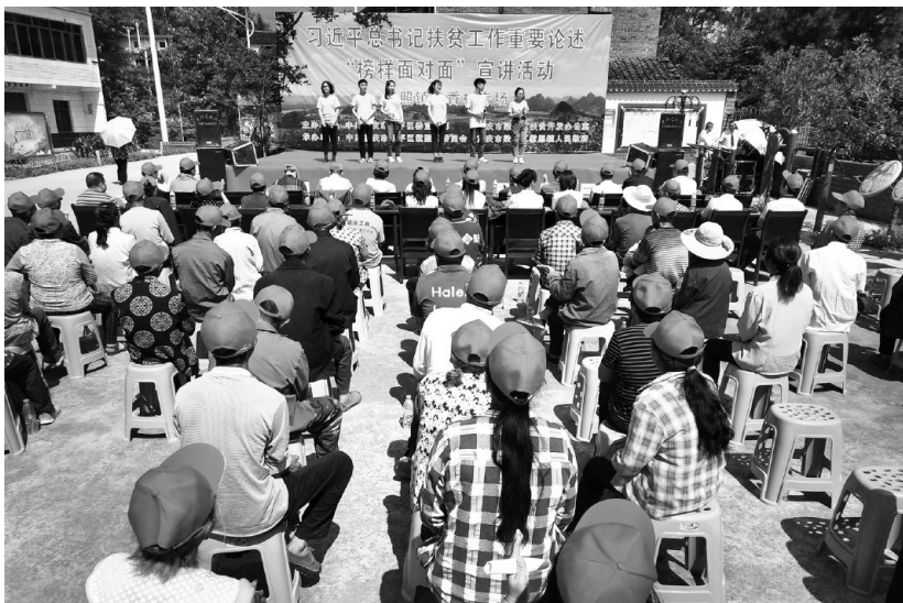
▲西南政法大学师生在重庆巫溪县天元乡开展脱贫攻坚主题宣传

上说是做人的工作”。高校要以高度的政治自觉、思想自觉、行动自觉，在遵循思想政治工作规律、教书育人规律、学生成长规律的基础上，坚持管理与说理、文化与文明、情感与情怀“三个并重”，真正让思想政治工作这条“生命线”活起来。