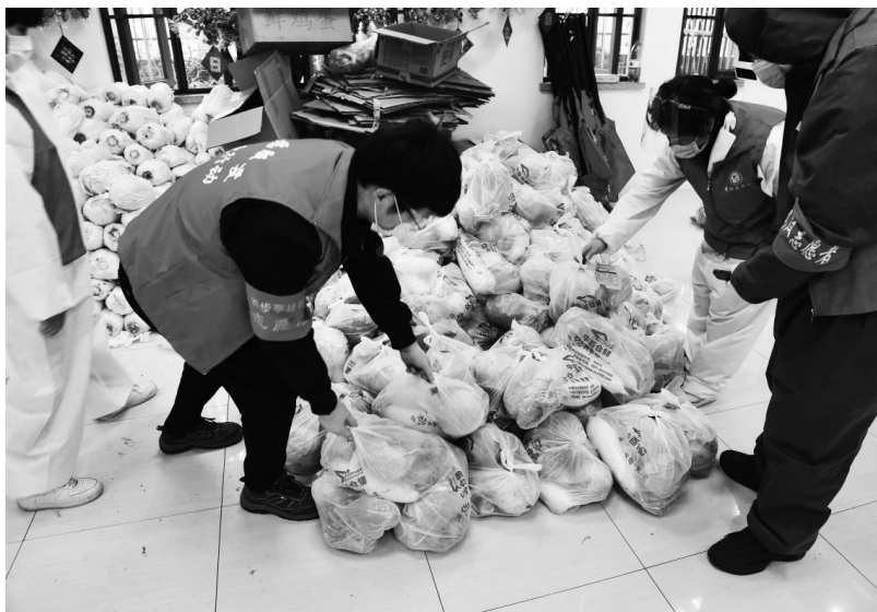
▲青年志愿者整理分拣“十元蔬菜包”并优先保障社区困难家庭

民族伟大复兴中国梦的政治高度、战略高度，对青年的历史地位和时代使命作出深刻阐述，强调“青年兴则国家兴，青年强则国家强。我们党自成立之日起，就始终代表广大青年、赢得广大青年、依靠广大青年”“中国共产党从来都把青年看作是祖国的未来、民族的希望，从来都把青年作为党和人民事业发展的生力军，从来都支持青年在人民的伟大奋斗中实现自己的人生理想”等等，鲜明地指出了青年在历史