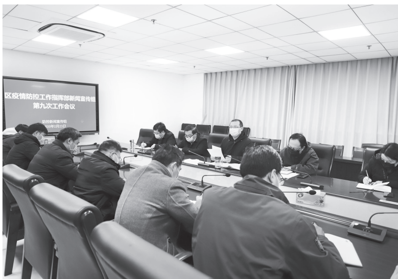
▲赣榆区委宣传部研究部署疫情防控宣传工作

精准分析疫情防控形势，抓牢疫情防控宣传关键环节，着力做到“全面发声”和“重点发力”。一是聚焦科学决策，传播权威声音。始终把中央和省市委重大决策部署作为宣传重中之重，第一时间发布市一级响应、十项措施通告、通知等内容，第一时间宣传复工复产规范措施、来苏来连健康申报等内容，第一时间报道“战疫情 当先锋 聚力量 作贡