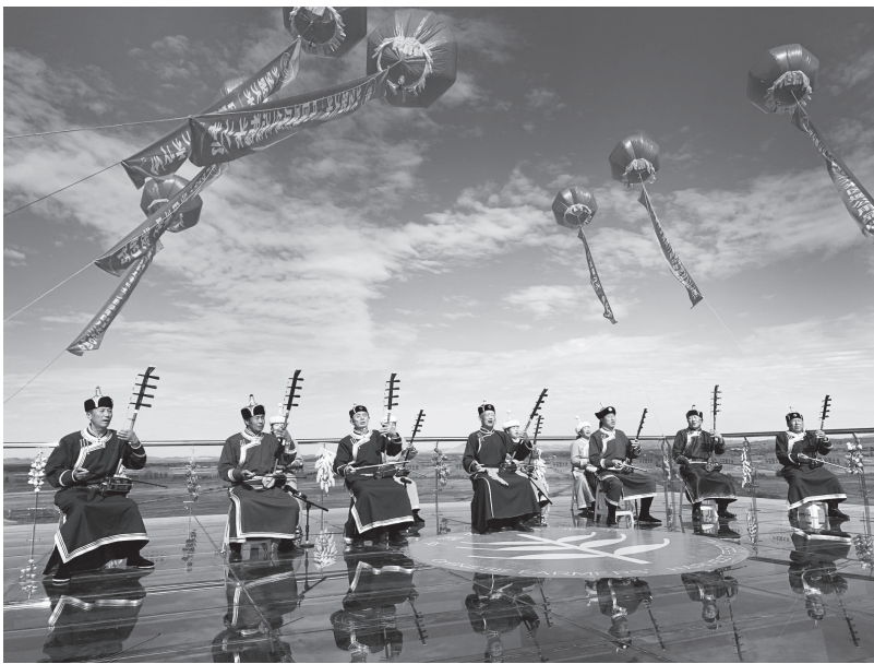
▲“讲、唱、传、演”多措并举，深入阐释习近平新时代中国特色社会主义思想

进村宣讲全面学。重点开展文化扶贫“十进村”活动，即习近平新时代中国特色社会主义思想宣讲进村、扶贫政策宣讲进村、社会主义核心价值观宣传教育进村、新时代农牧民素质提升进村、民族团结进步教育进村、法治宣传教育进村、脱贫典型故事分享进村、乌兰牧骑巡演进村、文艺志愿服务进村、励志主题电影展映进村，激发贫困群众脱贫致富的内生动力，促进形成自强自立、争先脱贫的精神风貌，每年开展“十进村”活动不少于200场次，每个嘎查不少于1次。