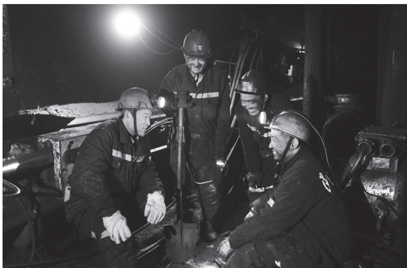
▲扎实开展一人一事思想政治工作，一矿干部利用井下工作之余与职工谈心

通过企业文化建设，干部队伍素质进一步提高。作为国有企业，政治文化是首要倡导的文化。阳煤集团倡导“以上率下、从严治党”的政治文化，企业领导人员思想政治素质明显提高。2019年，集团党委理论学习中心组组织学习28次，二级党委（党总支）累计