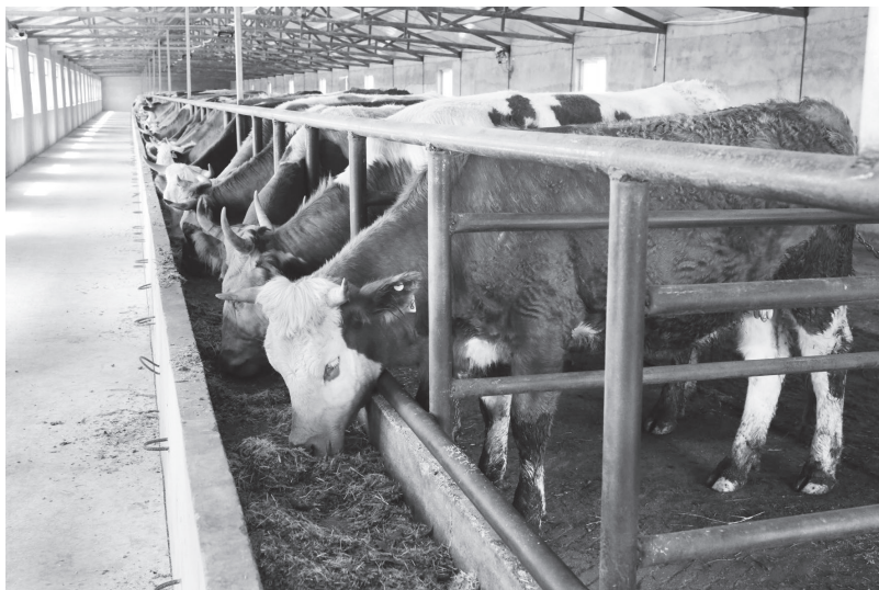
▲科右中旗巴彦呼舒镇嘎旦扎拉嘎嘎查白永生种养殖业专业合作社采取“党支部+合作社+基地+农户”生产经营模式，实现了合作社与贫困户的共赢

我禁”到“我要禁”的可喜转变，草原重现“风吹绿草遍地花”“万亩杏花如云似霞”的美丽景象。以多元增收带转变，完善龙头企业与农牧民利益联结机制，鼓励农牧民流转土地，促进农牧业规模化经营，让解放出来的劳动力更多投入到舍饲养殖、设施农业、庭院“五小”产业中。冬季各类产业蓬勃发展、欣欣向荣，农牧民冬闲人不闲，致富门路宽，一年四季忙挣钱。实施“互联网+”现代农牧业行动，开辟线上增收门路，培养一批“下地懂技术、上网能销售”的农民经营能手。推动文旅融合，重点打造图什业图王府、五角枫景区、翰嘎利湖等景区景点，带动发展图什业图王府刺绣、银器、四胡、奶制品等特色旅游商品产业。发展乡村旅游，培育农牧渔家乐30多家、自治区乡村旅游星级接待户8家。