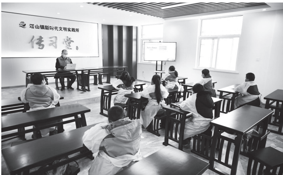
▲赣榆区塔山镇青年志愿者宣传防疫知识