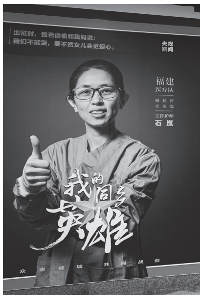
▲福州市与央视协作策划点亮全城7621面屏幕致敬医务人员

明确市属媒体及新媒体内容管理权限，避免多头指挥、信息多源。督促各级各部门在疫情防控中落实意识形态工作责任制，把好导向、守住阵地、管好队伍。针对拟出台的政策措施、对外发布的信息，比如口罩摇号销售等，提前开展舆情分析预判，统一组织市属媒体权威发布，把握主导权主动权。针对热点问题，组织市属媒体特别是新媒体第一时间发布权威信息，迅速有力回应关切。