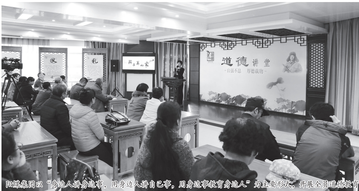
阳煤集团以“身边人讲身边事，用身边人讲自己事，用身边事教育身边人”为主要形式，开展全员道德教育