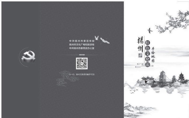
▲扬州红色文化游手绘地图