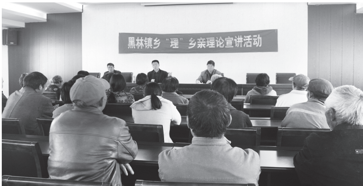
▲黑林镇乡“理”乡亲宣讲活动走进黑林村