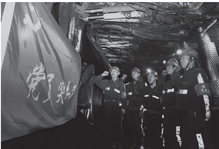
▲“社会主义是干出来的”岗位建功行动中党员突击队积极发挥先锋模范作用

打造党建工作品牌。将党建业务与互联网技术、信息化手段深度融合，构建起涵盖党建、人事、纪检、群团、宣传、信访，集信息采集、传输存储、数据分析、党建管理为一体的党建综合管理系统。实施“一组织一库”“一党员一库”，建立完善基层党建大数据分析系统和实时监控平台，加强综合分析比对和科学评估研判，强化对基层党组织建设质量的靶向监督和精准指导。加强党建业务工作标准化流程化建设，实现年初有计划、实时有数据、年终有“画像”。通过党建信息化平台，构建了国家能源集团智慧党建大数据系统，形成互联互通、信息共享、穿透预警、实时考评的工作格局。