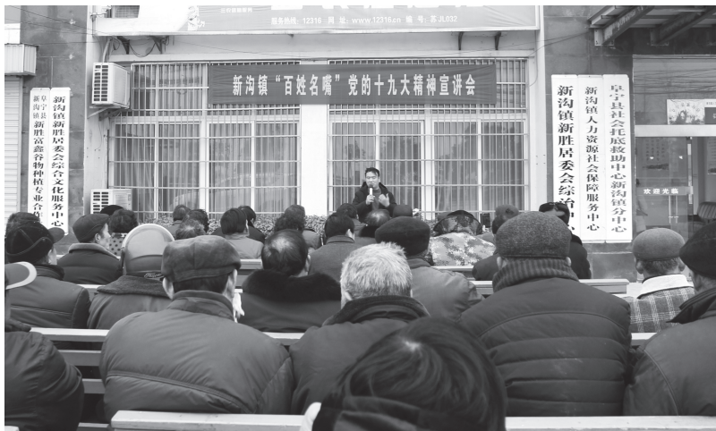
▲盐城市基层“百姓名嘴”宣讲团，赴基层集中宣讲党的十九大精神