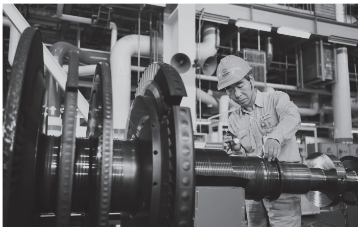
▲广大干部职工积极践行“社会主义是干出来的”伟大号召，精细检修助力生产运营百日会战

强化正向激励。贯彻落实新时代党的组织路线，把重实干重实绩用人导向鲜明树起来，把担当作为者大胆地用起来。加强经营管理、专业技术、技能三支人才队伍建设规划与实施，形成科学合理的人才梯队与储备体系，让广大干部职工有信心、有奔头。加强实干本领培养，向实践学习，向市场学习，向先进学习，练就真本领，善于抓落实，创出好业绩。坚持严管与厚爱相结合、激励和约束并重，让广大干部职工在实干中增长才干、在磨炼中锻炼成才。