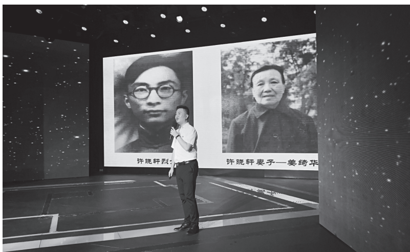
▲“让烈士回家”主题活动现场

云事迹展览馆、扬州中学树人堂、菱塘回族乡民族文化宫等基地，大力宣传展示“白衣圣人”吴登云、“两弹一星”元勋黄纬禄和国家最高科学技术奖获得者吴征镒、吴良镛等新时代奋斗故事和崇高精神，激励大家不忘初心、接续奋斗。二是搭建互动平台。核心价值观教育示范基地、东关小学将百年校训“将来治国平天下 全靠吾辈”有机融入社会主义核