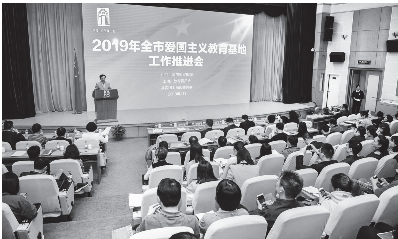
▲2019年全市爱国主义教育基地工作推进会