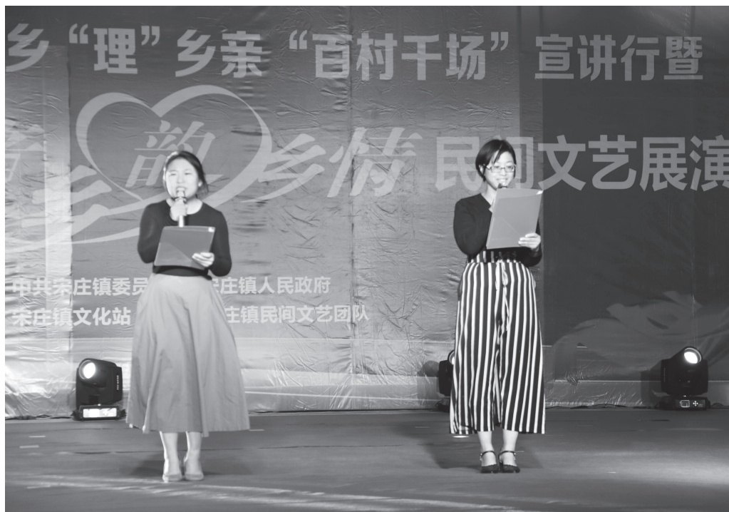
◀宋庄镇乡“理”乡亲“百村千场”宣讲行暨“乡情乡音乡韵”民间文艺展演在该镇乡村大舞台演出

色社会主义思想宣讲任务清单，动员107家机关企事业单位120名科级以上领导干部带头深入社区和农村基层一线讲党课、作报告，带动普通党员和一线工作者走上“街巷”宣讲台，在宣讲中紧扣主题主线，突出乡村振兴、民生实事等群众普遍关心的热点问题，不照本宣科，运用方言、乡音、家常话，确保群众听得懂、能领会、记得住。二是寓教于乐，组建“乡音”演出队。组织15支乡“理”乡亲农村文艺巡演队伍，坚持方言特色，创作三句半、快板书等形式的理论曲艺作品200多个，让群众乐意听、容易记。两年来，开展理论惠民演出达20多场。厉庄、石桥等镇结合“乡情乡音乡韵”文艺汇演，将乡“理”乡亲宣讲活动贯穿在乡村大舞台的京剧、小品等节目中，在努力丰富群众文化生活的同时宣传党的十九大精神和