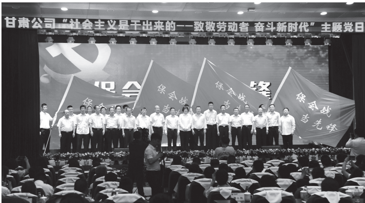
▲国家能源集团全系统开展“保会战 当先锋”主题党日活动