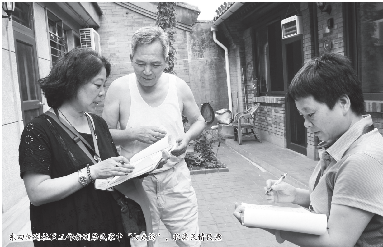
东四街道社区工作者到居民家中“大走访”，收集民情民意