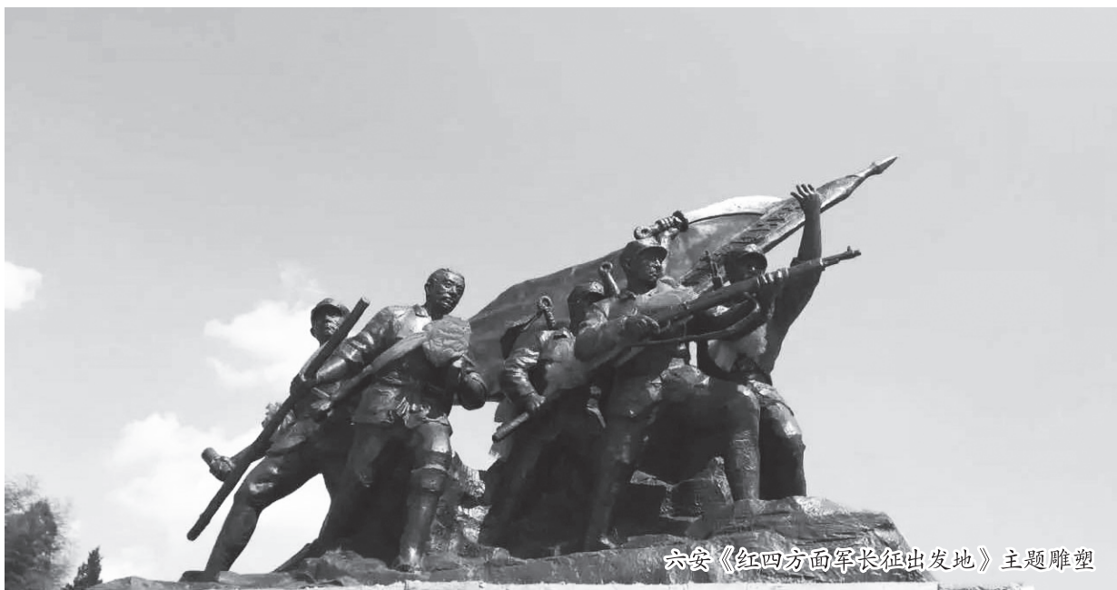
六安《红四方面军长征出发地》主题雕塑