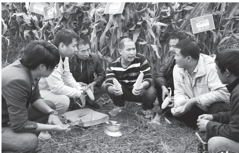
▲延吉市新时代文明实践依兰镇志愿服务支队，组织科技志愿者向农民讲解科普农业知识

延吉市在推进乡村人居环境和乡风文明建设的同时，深入挖掘、整理东北抗联革命斗争遗址遗迹，打造一批红色文化景址，帮助各镇村发展红色旅游经济。以小营镇五凤村为