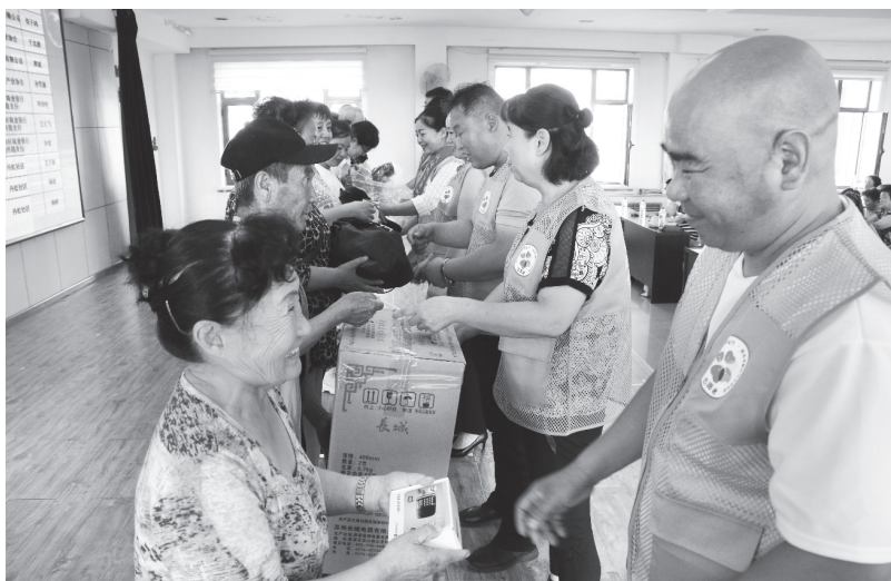
▲延吉市新时代文明实践北山街道志愿服务支队开展“圆梦微心愿，情暖你我他”微心愿认领活动

不同对象、不同宣讲需求，用浅显易懂的百姓话、民族语把大政事、大理论、大政策讲明白，目前已经开展双语宣讲20余场。