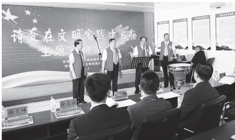
▲农安县巴吉垒四合村新时代文明实践站在开展活动

联建融媒体中心，解决“各自为战”问题。农安县既是建设全国新时代文明实践中心试点县，同时也是县级融媒体中心建设试点县。通过工作发现，虽然两者侧重点各有不同，但根本目标一致，都在于宣传群众、引导群众、服务群众、凝聚群众。因此，县委宣传部作为主责部门，创造性提出并探索实施“两个中心”相贯通的新路子，有效解决资源整合难、群众点单难、过程追踪难、考核评估难等实际问题。借助云计算、大数据等先进