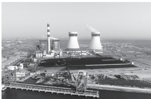
▲中国电建投资开发建设的巴基斯坦卡西姆1320兆瓦燃煤电站

全面推进企业外宣工作。落实中央企业外宣工作指导意见，切实发挥企业外宣主体作用，建立“六个一”外宣工作机制，积极构建国际话语体系，主动邀请海外媒体对在建重大项目进行采访报