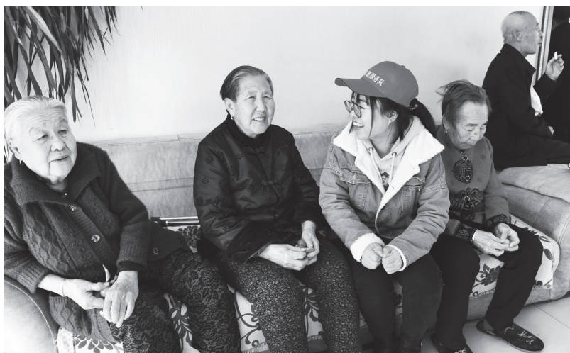
▲供水公司志愿者到滨河乡敬老院慰问

树立典型精品,解决“缺少样板”问题。针对新时代文明实践工作的探索与开创性,农安县在全面推进新时代文明实践工作的同时,发挥示范引路作用,打造工作标杆,解决基层站所工作缺少样板问题。着力打造了开安镇新时代文明实践所、合隆镇陈家店村新时代文明实践站等几个精品示范样板,从组织架构、基础阵地、志愿者队伍、品牌服务项目、工作运行制度和机制体系等方面,全力加强视觉体系(标识、制度、展板等)、实践体系(志愿队伍、志愿项目、活动开展等)和成果体系(文本、图片、专题片等)建设,并在全县培训推广,使之有规可依、有例可循,大大提高了工作效率和质量。在此基础上,分别在县乡村三级选树亮点,全县按照五个片区划分,分别确定1-2个乡镇为文明实践片区中心所,形成典型引路、梯次跟进全局铺开的良好