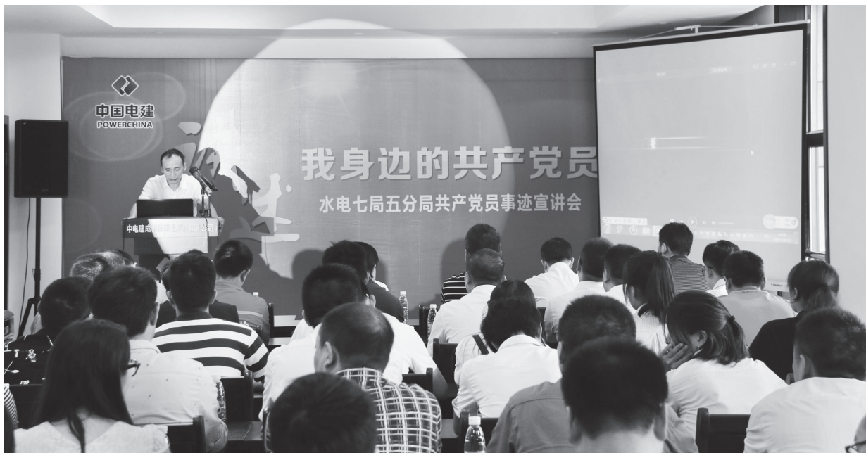
▲中国水电七局开展“我身边的共产党员”宣讲

合所有制企业党建工作的指导意见。围绕强化境外宣传工作，做到境外党员教育管理、工作运行机制、党的宣传工作“三个全覆盖”。围绕创新党建工作机制，积极探索党员欢迎、职工认可的宣传工作新载体、新平台、新方式。大力推进宣传思想工作形式载体创新，积极开展微视频、微电影大赛，注重从网络化、移动化上想办法，注重在通俗化、大众化上下功夫，将思想内容呈现为党员干部职工喜闻乐见的图片、短视频、微电影，有效提高宣传思想工作可触可感的温度、鲜度和色彩。