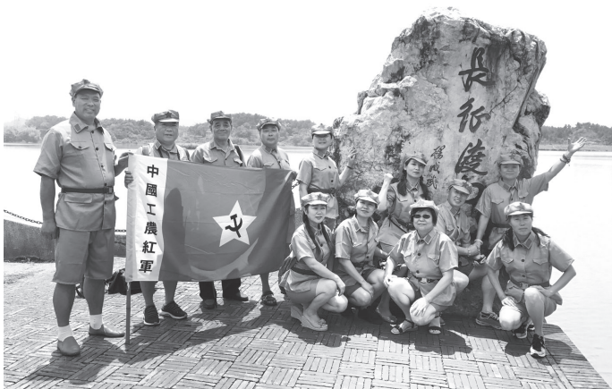
▲2017年8月17日，小分队在中央红军长征出发地——江西省于都县于都河老渡口

行学习，对旗手、参与人员进行队列训练，对红军着装的仪容仪表及形象提出具体要求，以更真切地体验红军精神，传播红军形象。