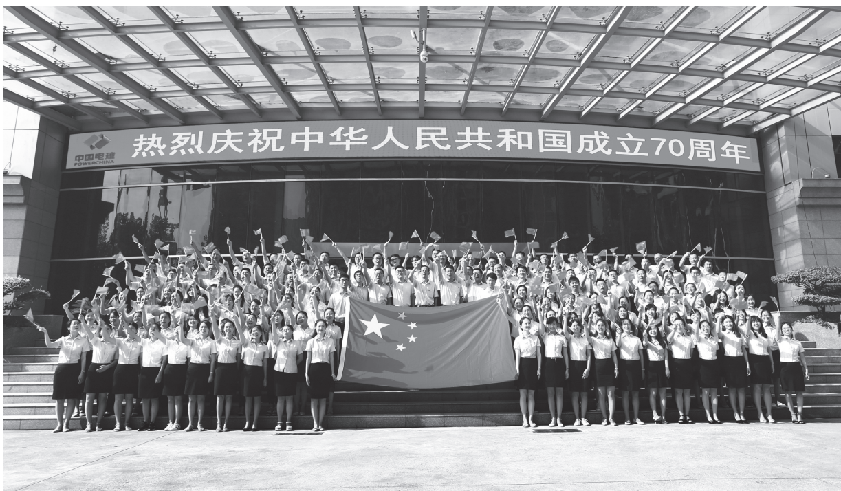
▲中国水电十一局百名职工合唱《我和我的祖国》