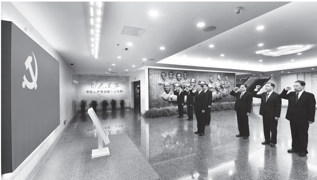
▲不忘初心、牢记使命：习近平总书记带领其他中共中央政治局常委同志一起重温入党誓词