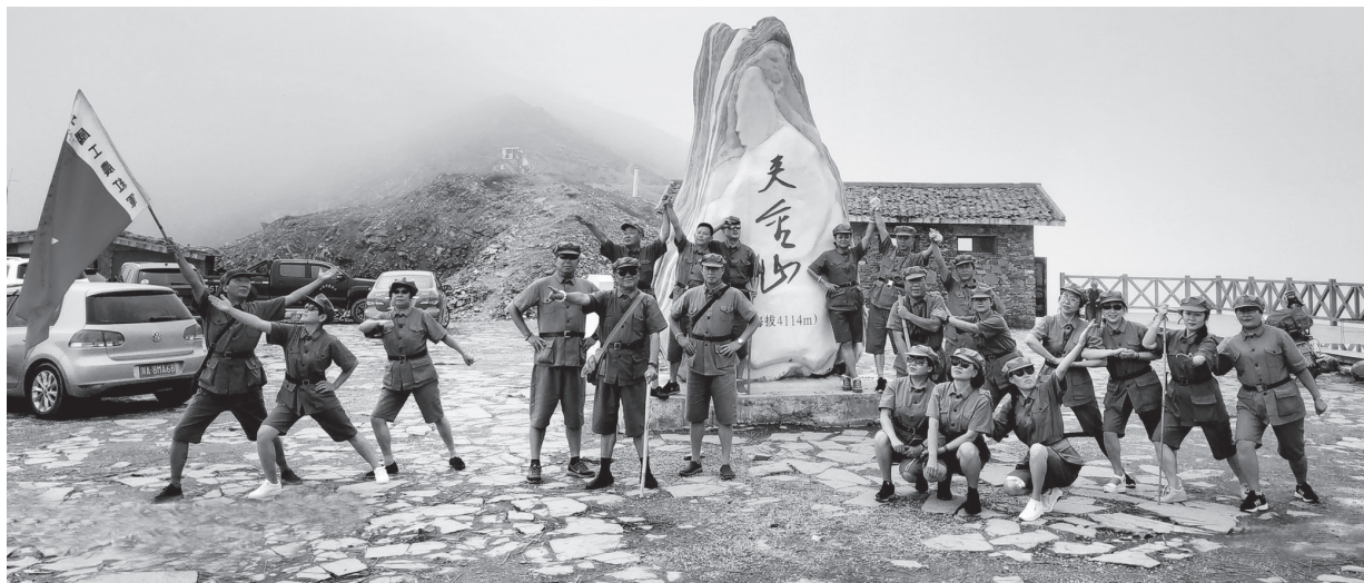
▲2018年8月22日，小分队翻越夹金山，这是中央红军长征翻越的第一座雪山，海拔4114米

“爬雪山、过草地”是我们听过的关于长征艰险的故事中描述得最多的。如今随着现代化建设，长征路上的路况已得到极大提升，但当我们车队行