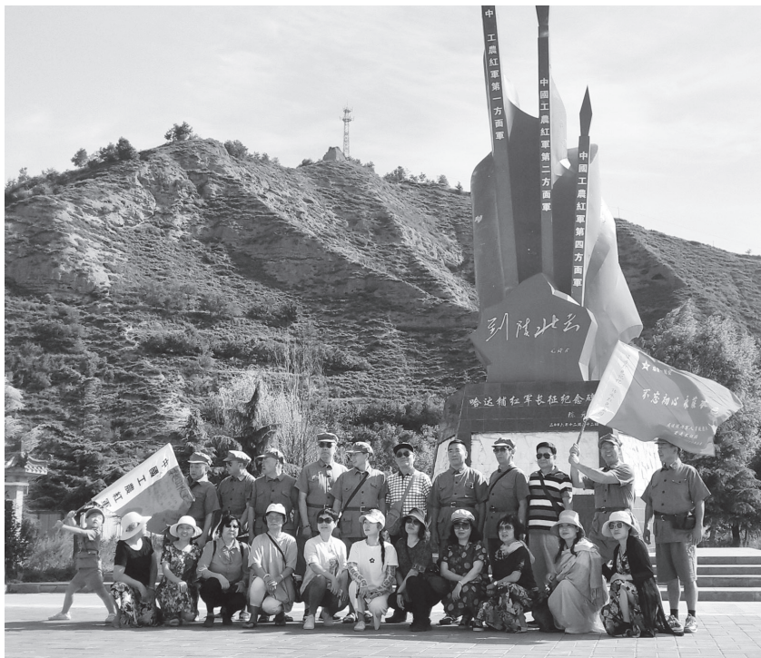
▲2019年8月4日，小分队在甘肃宕昌县哈达铺红军长征纪念碑前

小分队来到中央红军长征的终点吴起县，登上吴起城边的胜利山。站在胜利山上，我们这些断断续续用了三个年头时间重新丈量了长征路的老兵们，在夕阳的余晖下眼含热泪，肩并肩，手挽手，眺望着身后的万水千山，感怀着当年前辈们走过的25000里历程，心中不禁激情澎湃，感慨万端，进一步丰富了思想，砥砺了灵魂，更加坚定了听党话、跟党走信念。