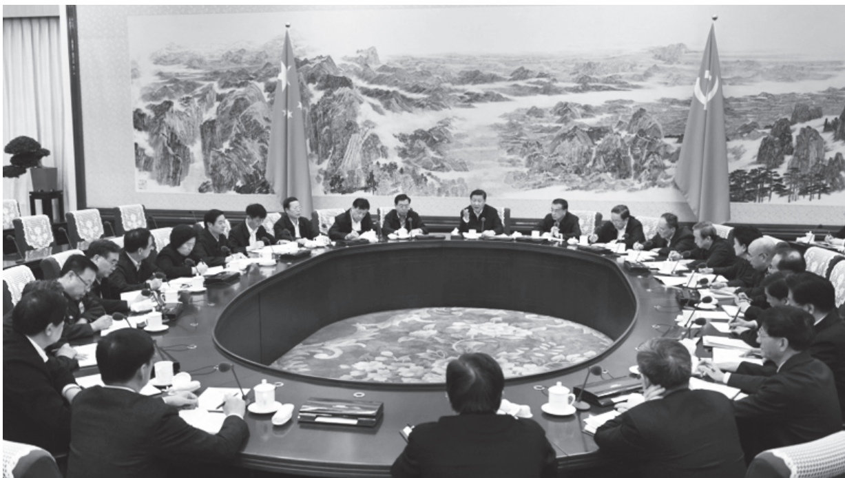
▲ “三严三实”专题教育：全党要向中央看齐(新华网)

改落实、建章立制3个环节。这次活动使党在群众中的威信和形象进一步树立，党心民心进一步凝聚，形成了推动改革发展的强大正能量。