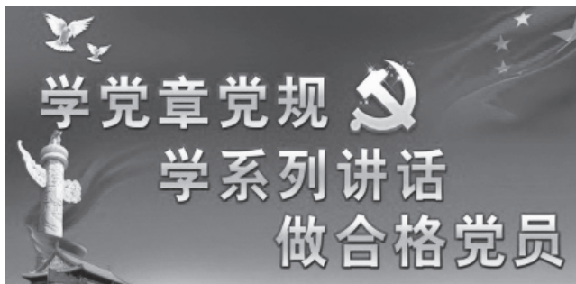
▲ “两学一做”学习教育：有针对性地解决问题

真正把党的政治建设抓在日常、严在经常。2017年3月，中办印发《关于推进“两学一做”学习教育常态化制度化的意见》，把这项学习教育作为今后党的政治建设中的一项经常性任务固定下来。