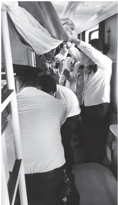
▲列车工作人员为孕妇搭建“临时产房”

这是一趟开往太行山革命老区的普通列车，车速较慢，透过车窗，可以看到沿途城镇乡村，到处红旗招展，迎风飘扬；可爱的祖国，已经进入喜迎70华诞的倒计时了。