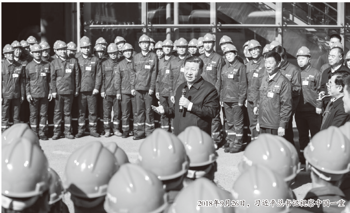
2018年9月26日，习近平总书记视察中国一重