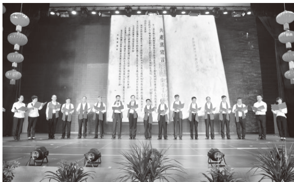
▲中国一重党委举办纪念建党97周年“我心中的十九大·红色经典诵读”暨七一表彰大会