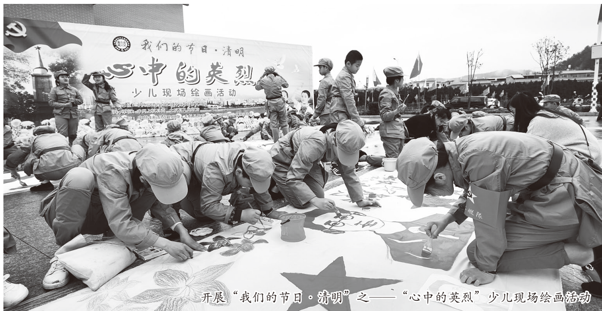
开展“我们的节日·清明”之——“心中的英烈”少儿现场绘画活动

生活服务类39件、教育文化类18件、科技科普类3件、生产发展类21件、其他类22件。二是由县级实践中心统一根据群众需求，依托“志愿汇”和“志愿云”信息管理系统，策划生成志愿者服务项目、招募志愿服务队伍，深入基层有针对性地开展志愿服务活动，通过搭建互联网平台，实现志愿服务项目生成策划、志愿者招募调动智能化、信息化、特色化管理，达到志愿资源配置最佳化、服务效用最大化，切实做到“百姓有所呼，服务有所应”。三是依托在田间地头、凉亭树下等百姓生产生活、休闲娱乐集中的地方，在全县设立打造100个便民服务和集中宣讲点，以菜单式、互动式深入基层开展党的政策理论、乡风文明、移风易俗、扫黑除恶等宣讲咨询服务，真正实现“群众聚集在哪里，文明实践就延伸覆盖到哪里”。四是依托全县各级各部门官方宣传矩阵，加强无人机、大