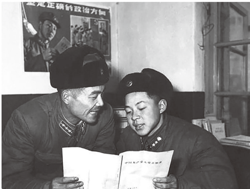
▲1960年11月雷锋入党，被选为抚顺市人大代表。图为雷锋在填写入党志愿书

记使命”主题教育中，始终注意筑牢信仰之基、补足精神之钙、把稳思想之舵，像雷锋那样坚定地为之奋斗一生。