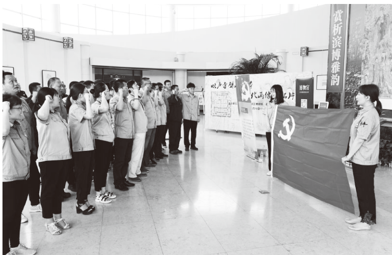
▲天津重工党委组织党员在滨海新区博物馆开展主题党日活动