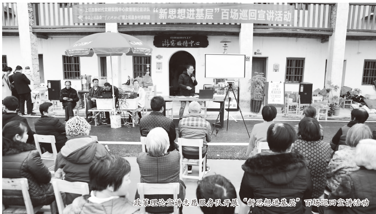
政策理论宣讲志愿服务队开展“新思想进基层”百场巡回宣讲活动

福建省龙岩市上杭县是全国著名的革命老区。自2018年8月被列入全国新时代文明实践中心试点县以来，上杭深入贯彻落实习近平总书记“推进新时代文明实践中心建设”重要指示精神，按照中央和省、市的部署要求，突出地域特色，大力开展“爱满杭川”文明实践志愿服务活动，坚持高标准、高质量、高水平，科学统筹、全面布局，扎实推进新时代文明实践中心试点建设，以“四轮驱动”形