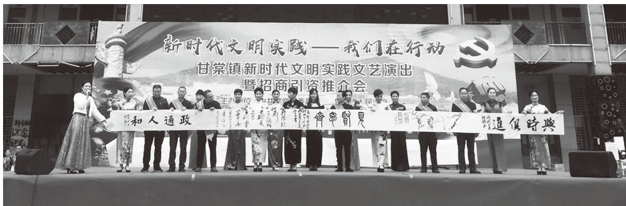
▲甘棠镇新时代文明实践文艺演出活动

政策、送文化、送科技、送文明、送健康、送幸福”的“四下七送”文明实践活动。深入开展理论进基层“百千万”工程，以领导干部带头讲、理论骨干重点讲、乡村讲师团深入讲、文艺分队生动讲、融合媒体立体讲相结合的方式，先后组织开展“理论宣讲轻骑兵”“廉政讲坛”“理论下基层”等各类活动400多次，宣传解读习近平新时代中国特色社会主义思想，把习近平新时代中国特色社会主义思想、党的政策送到群众身边；开展“农业科技强筋壮骨计划”，举办技术培训、科技指导和科技咨询活动，助力乡村振兴；开展“书香福安——全民读书月”“社区文化五个一工程”等活动，丰富群众文化生活；持续开展“我们的节日”“社区群星秀”等活动，把文艺活动送到群众身边；传统民俗文化活动与新时代文明实践相结合，广泛开展“移风易俗”等各类志愿服务宣传活动，把乡风文明送到群众身边；开展建档立卡贫困户精准扶贫活动，为群众提供帮扶，把幸福送到群众身边。