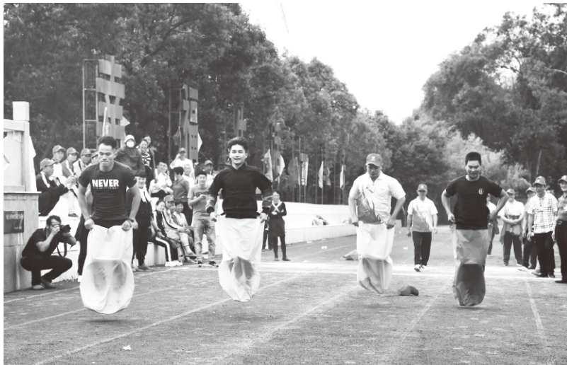
▲举办片区农民文化体育节

针对志愿者传统调动方式存在反应不及时、信息分享不全面、教育培训开展不方便等问题，坚持“线上”和“线下”同步推进。一是依托县民情处理中心、三农服务中心、艺术中心、“12345”便民服务中心、行政服务中心、市民服务中心等“六大中心”以及e龙岩APP便民服务平台作用，畅通需求反映渠道，及时收集汇总百姓诉求、所思所盼。自新时代文明实践中心成立以来，通过“六大中心”共收集群众需求信息98件，包括