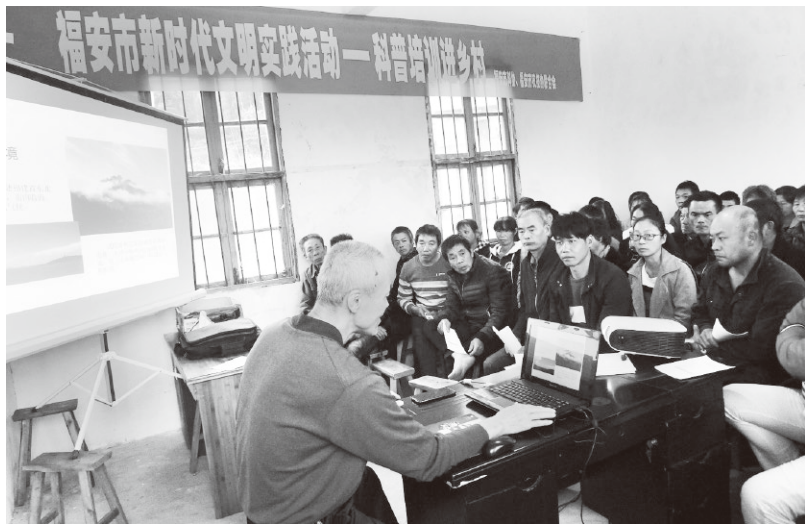
▲福安市新时代文明实践活动——科普培训进乡村活动

整合志愿资源，构建志愿服务覆盖网络。建立市、镇、村三级新时代文明实践志愿服务队伍，并以服务总队、服务分队和服务小队方式开展活动，各级党组织一把手任队长。镇、村层面，注重吸收在群众身边威信高、口碑好的党政干部、教师、乡贤、退休人员、科技能人、乡土文化工作者、先进人物、道德模范典型等，实现市、镇、村志愿服务队伍全覆盖。发挥市级部门的专业和职能优势，搭建理论宣讲、社会宣传、教育服务、文