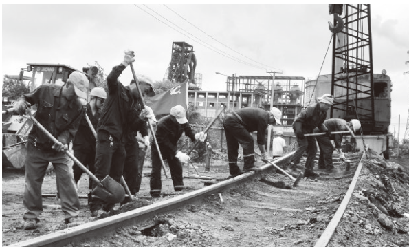
▲中国一重铁路运输中心开展清理铁道党日活动

进入新时代，中国一重将按照习近平总书记视察时提出的七个方面的勉励要求，积极贯彻新发展理念，坚持创新驱动发展，加快发展先进制造业，坚持以提高质量和核心竞争力为中心，扩大高质量产品和服务供给，占领世界制高点、掌控技术话语权，阔步从“中国制造”向“中国创造”大步迈进，全力提升中国经济的全球价值链地位。