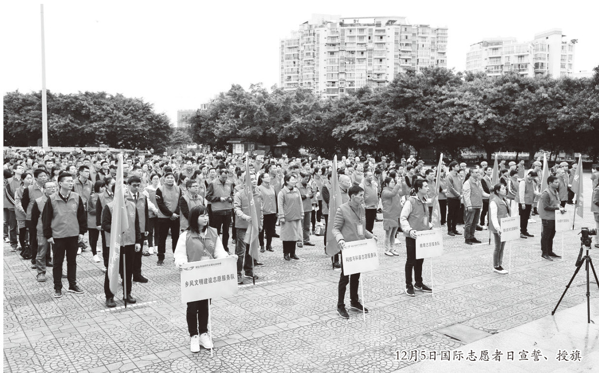
12月5日国际志愿者日宣誓、授旗