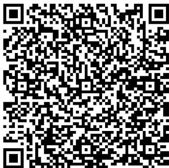
▲扫描二维码进入微视频

2009年底，根据市委组织部、市建设党委关于加强“工地党建联建”的要求，上海建工在静安区嘉里中心工地成立了第一家工地党支部。轨交12号线南京西路车站工地毗邻上海特色老式石库门建筑，建好工程时留下了“三个一百”的动人故事。施工区域内有棵树龄超过百年的广玉兰古树，项目党支部沿古树保护