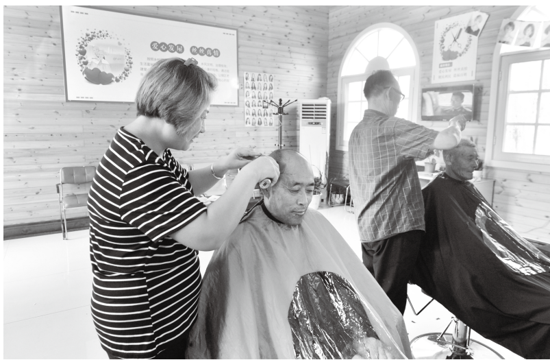
▲胶州市新时代文明实践胶东分中心的爱心发屋中，志愿者为老人理发，目前胶东分中心已设立爱心发屋14个

践站的日常工作，对上联系市级中心、志愿服务总队和5支指导员队伍，争取业务指导、专业培训；对下根据群众需求，有针对性的设计实践活动，并组织开展活动。“N”即因地制宜组建N支志愿服务实践队伍，如以党员奉献为主的党员志愿服务队、入党积极分子义工队；以邻里互助为主的爱心大姐义工团、守护夕阳义工队；以村庄管理为主的网格员包街志愿服务队、好女婿好丈夫义工队、好媳妇好婆婆志愿服务队；以文化演出为主的邻里艺术团志愿服务队、庄户剧团志愿服务队；以文明新风弘扬为主的移风易俗普及宣传志愿服务队；以专业服务为主的爱心医疗志愿服务队、民生就业志愿服务队、爱心发屋志愿服务队、爱心洗衣志愿服务等。广大的志愿服务实践队伍是在基层开展文明实践活动的力量，志愿者来源于党员干部、文化带头人、道德模范、致富能