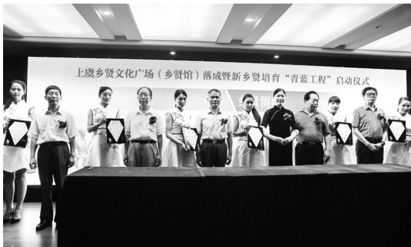
▲上虞乡贤文化广场（乡贤馆）落成暨新乡贤培育“青蓝工程”启动仪式

1. 新乡贤的构成。“乡贤”从定义上看，是“生于其地，而德业学行著于世者”，是本乡本土有德行、有才能、有声望而被当地民众深受尊重的贤人。地域性、知名度、道德观是构成“乡贤”的三个基本要素。传统的乡贤主要是士绅阶层，也就是在乡村德高望重的人。而新乡贤则在范围上进一步扩展，有专家