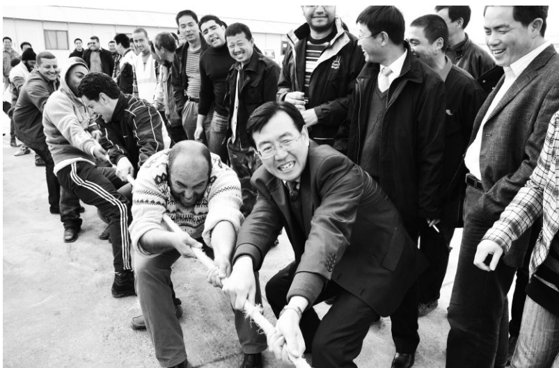
▲中国铁建海外员工进行拔河比赛

课题以中国铁建海外公司的跨文化管理为样本,通过收集跨文化管理基本信息、数据与案例,采取深度访谈、问卷数据分析、案例剖析等方法,对中央企业海外公司跨文化管理进行理性分析,探讨引发跨文化冲突的诱因、跨文化管理应遵循的原则和有效途径,提出中央企业海外公司跨文化管理策略。本课题设置了6套调查问卷,覆盖跨文化管理的“跨文化冲突”“合作者”“利益相关者”“社区公民”“员工培训”“环境保护”6个主题,共155个参考选项。接受调查问卷