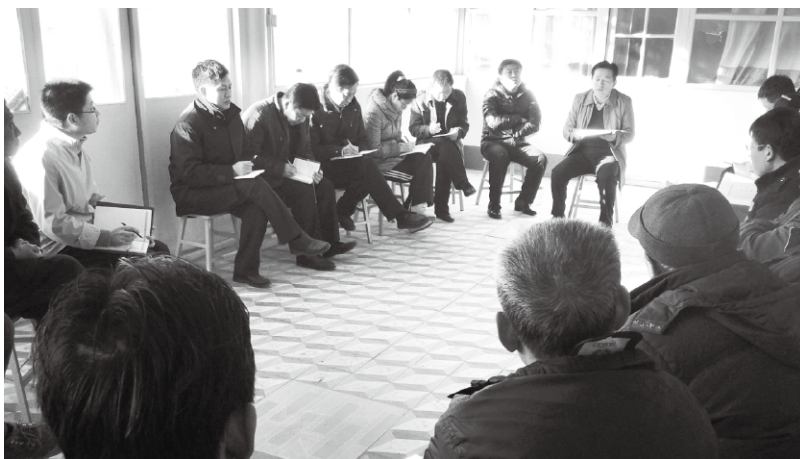
▲干部与村民座谈交流破除思想藩篱

自然资源匮乏、基础设施薄弱的偏远地区,贫困程度深,减贫成本高,脱贫难度大,不仅物质贫困,而且精神也贫困。