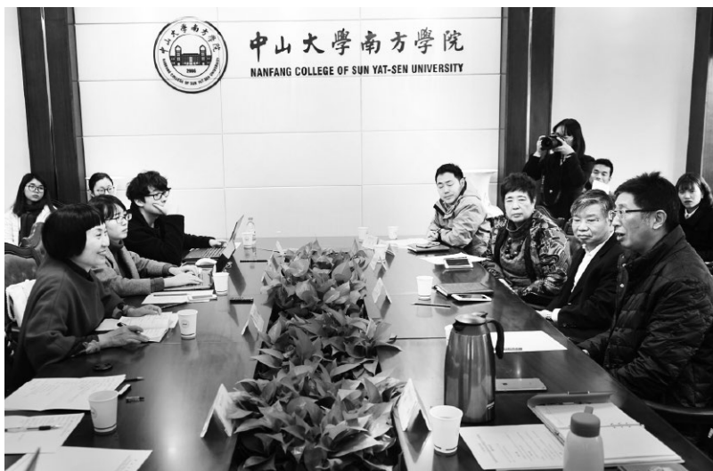
▲课题组一行在中山大学南方学院调研

广东各高校始终坚持思想政治工作“因事而化、因时而进、因势而新”的原则，着力于新媒体新技术与思想政治工作的结合，通过富有创新性、针对