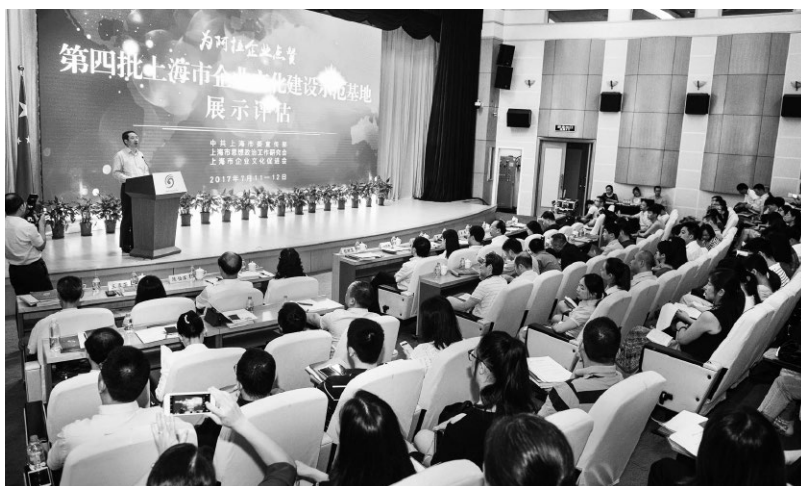
▲“为阿拉企业点赞”第四批上海市企业文化建设示范基地展示评估现场

第一阶段是80年代,为引进企业文化概念、倡导企业精神时期。上海在国有企业中最早引入“企业文化”的企业管理理论,主要方式是提炼和倡导企业精神。如原上海无线电十八厂的“飞跃精神”、上钢三厂的“三钢精神”等。这个时期,上海高校开始研究企业文化理论,并作出本土化的诠释和解读。