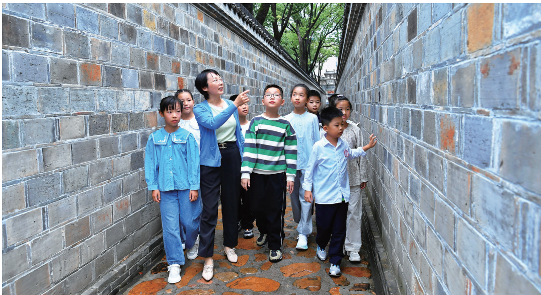
▲桐城市北街小学组织学生到六尺巷开展现场思政课