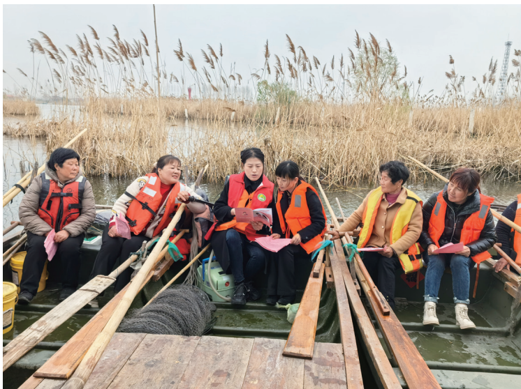
▲济宁市微山县“湖上宣讲船”

搭建品牌矩阵，打造理论宣讲“集群效应”。 着力打造以市级“习语润儒乡”宣讲品牌为引领、县级“一县一品”为支撑、行业特色宣讲品牌为补充的“1+14+N”的宣讲品牌矩阵。一是“一县一品”彰显特色。14个县市区结合本地文化优势打造特色宣讲品牌，如曲阜“杏坛新语”、兖州“‘兖’讲乐万家”、邹城“邹鲁新声”、梁山“理响梁山”、太白湖“太白说”等理论宣讲品牌，在基层一线广受欢迎、落地生根。二是机关部门宣讲品牌不断壮大。机关工委“初心讲堂”聚焦党性教育，通过专家解读、党员分享筑牢思想根基；老干部局“银龄开讲”发挥“银龄”优势，深入基层宣讲红色故事、传承优良作风；总工会“运河工匠说”组织劳模工匠走进车间班组，激发一线职工奋斗热情。各具特色的宣讲品牌协同发力，真正让宣讲讲得其所、讲出实效。三是乡土品牌“百花齐放”。各乡镇（街道）、村（社区）创新培育了一大批主题鲜明、形式新颖、群众喜爱的宣讲活动品牌，如任