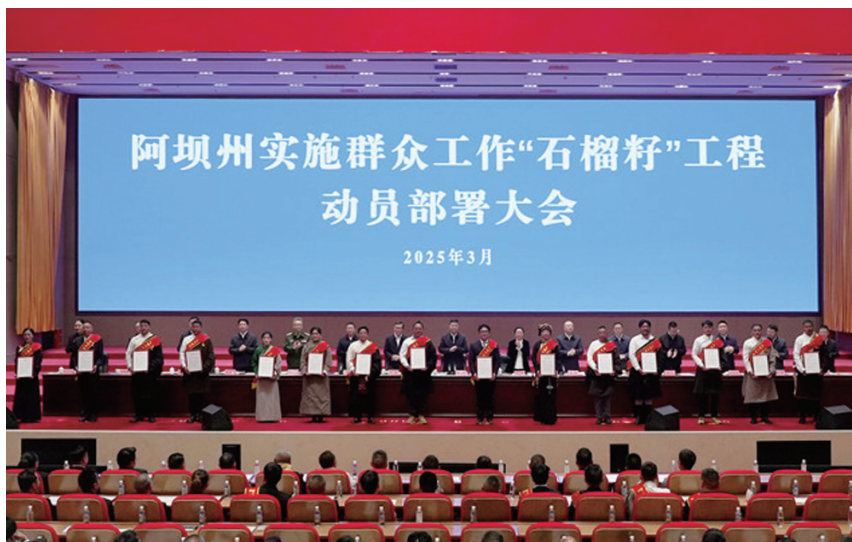
▲阿坝州召开实施群众工作“石榴籽”工程动员部署大会

做深做实“就业创业”行动，让每一个怀揣梦想的青年都能看到希望。阿坝州将“每个家庭至少一人就业”作为民生头等大事。重点聚焦大中专毕业生，通过“一人一档”提供精准就业服务，并采取培育产业、深挖州县岗位、争取省市帮扶等措施，全面消化存量未就业毕业生，强化“读好书、有出路”理念。同时全面消除“零就业家庭”，结合技能与岗位需求开展订单式培训，实施以工代赈，对接州内重大项目建设拓宽输出渠道，优先解决困难家庭人员就业，促进农牧民及困难职工子女就业创业，实现城镇新增就业7000人。大力支持创业，落实返乡创业21条措施，提供一站式服务；对未就业高校毕业生、返乡农民工首次创业，在享受国省补助基础上，州级再给予1万元补贴；实施创业担保贷款贴息（最高30万元，贴息80%），解决资金难题，助力创业者人生如“石榴籽”般饱满充实、熠熠生辉。