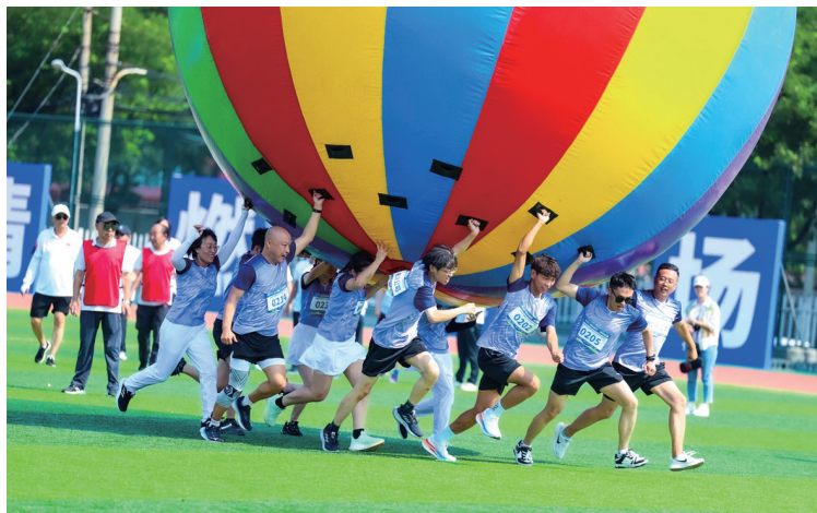
▲举办“同心筑梦 奋进新程”职工运动会

深化理论武装，坚守使命担当。坚持用党的创新理论凝心铸魂、强基固本，统领改革发展各项工作，抓实“第一议题”、中心组学习、基层组织学习、教育培训、理论研究宣传，教育引导干部职工从服务“制造强国”“健康中国”“一带一路”建设高度，认识和把握集团战略发展的重大意义。每年8月重温习近平总书记考察沈阳机床时的重要讲话精神，强化使命担当，激发