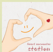
心灵辅导师：周永红 (重庆师范大学教育科学学院教授)

问：老师您好。我今年36岁，人至中年的迷茫突然激增。一方面来自职场的挫败感，我在一家地方金融机构工作已经13年，除了埋头苦干的韧性，没有丝毫资源优势和发展的，目前还是基层员工，加之行业待遇层级的差距，让我备受打击，不喜欢的工作环境，让我几次三番有离职的打算。另一方面来自孩子教育的压力，儿子7岁上小学一年级，每天都有很多作业，想给他更多自由空间与应试教育淘汰制的矛盾让我情绪不稳，经常对孩子发脾气。我很想突破，又想“躺平”休息，总是权衡却止步不前。我该怎么办？