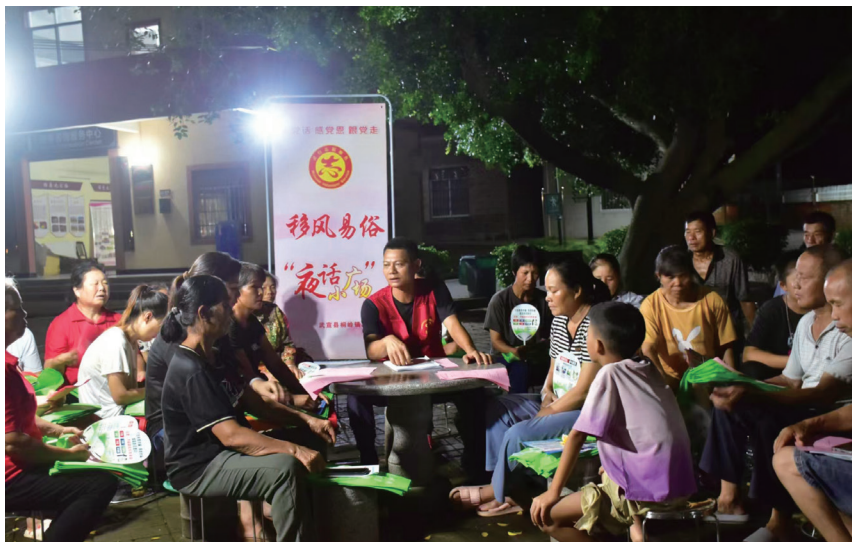
▲武宣县桐岭镇和律村开展“夜话小广场”活动

多场次，解决各村群众担忧和疑虑难题1万多件。二是活动交心聚民心。“‘十规两约’树新风，‘五个统一’移旧俗；红白喜事要报备，简办新办不浪费。红事不超20桌，500元一桌已欢乐；白事少于3天办，400元一桌菜品足……”此为忻城县隆光村傍晚时分在文明实践舞台举办移风易俗“忻风夜话”主题活动时，山歌手通过山歌向群众宣传本村“五个统一”的内容。结合桂中地区群众爱唱山歌的特点，来宾