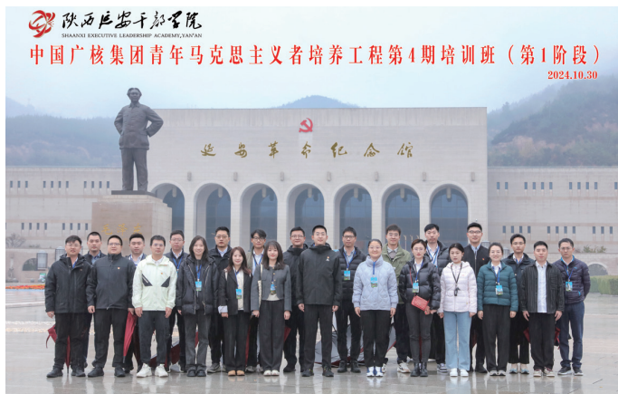
▲集团青马学员参观延安革命纪念馆

以高标准发掘优秀人才。严格落实组织选拔程序，通过个人自荐、组织推荐、集体评议等环节，每年从基层选拔一批具有潜力的经营管理类、科技