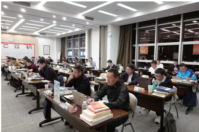
▲集团定期举办青年干部培训班

举办专题党课，把准前进“方向盘”。邀请党委领导讲授“青年成长第一课”、形势与战略专题党课，勉励青马学员将个人成长与事业发展相结