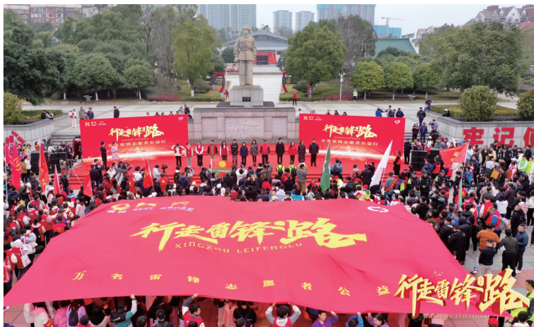
▲“行走雷锋路”万名雷锋志愿者公益行徒步活动

壮大志愿服务队伍。出台专门实施方案，建立区、街镇、村（社区）三级学雷锋志愿服务网络，组建区新时代文明实践志愿服务总队，下设15支志愿服务支队，各街镇共设立55