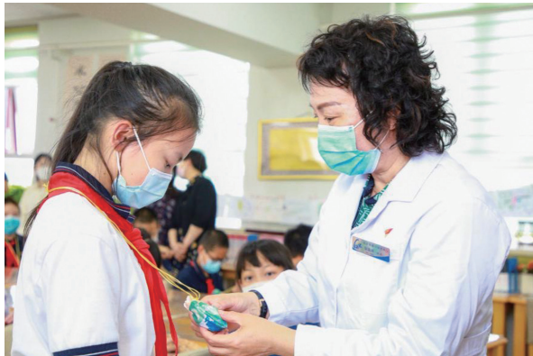
▲鼓楼岐黄志愿服务队走进灯市口小学

构建传播矩阵，把榜样故事传出去。 在北京市委宣传部指导下，构建上下贯通、左右联动、线上线下协同发力的宣传体系，实现纵向市—区县—乡镇贯通与横向党政机关各部门、各系统、各单位联动。组织召开北京市思想政治工作经验交流暨“双优”表彰座谈会，营造全市学习“双优”的舆论氛围，掀起学习高潮。用好“五一”国际劳动节等重要时间节点，动员引导“双优”单位运用宣传栏、内网、公众号等宣传载体，组织单位运用事迹报告会、经验交流会等宣传方式，对先进典型事迹进行集中宣传，形成强大合力。在《北京日报》及各区党报党刊刊登“双