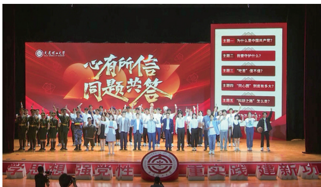
▲举办师生串并联理论学习讲演会

高校学生心理健康工作是涉及多要素协同交互的复杂开放系统，涉及大学治理多环节交叉联系和与家庭社会资源信息互动。高校要切实发挥