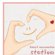
心灵辅导员：周永红 (重庆师范大学教育科学学院教授)