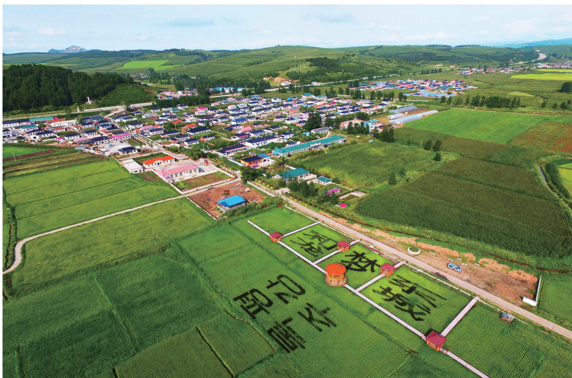
▲延边朝鲜族自治州光东村——歌曲《红太阳照边疆》描绘的地方

“红太阳照边疆，青山绿水披霞光，长白山下果树成行，海兰江畔稻花香……”一首《红太阳照边疆》曾火遍大江南北，唱出了延边大地的风土人情和延边人民团结向上的精神风貌。