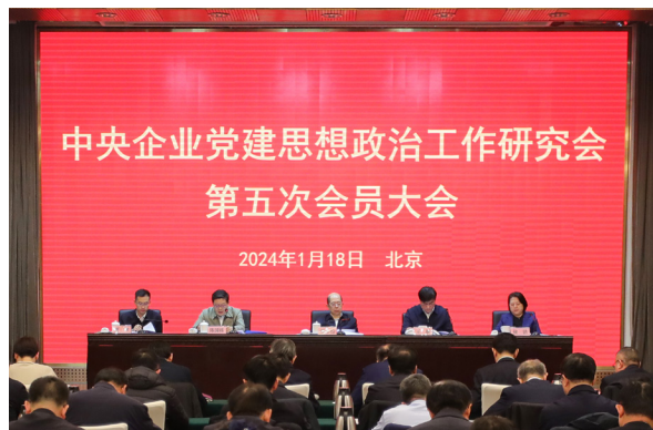
▲ 中央企业党建思想政治工作研究会第五次会员大会

突出机制建设，把牢课题研究“质量关”。 加强央企两级政研会的组织建设，持续提升课题研究的制度化、规范化、科学化水平。健全以章程为核心的内部管理制度，规范工作流程、优化机制方法，持续完善以课题组为基本组织形式、以课题立项为主要载体、以评审公示为激励手段、以成果转化应用为主要目标的工作流程和机制，不断推出更多高质量课题成果。构建以问题为导向的课题研究制度，每年确定30余个重点选题，组织各中央企业按照上一年度