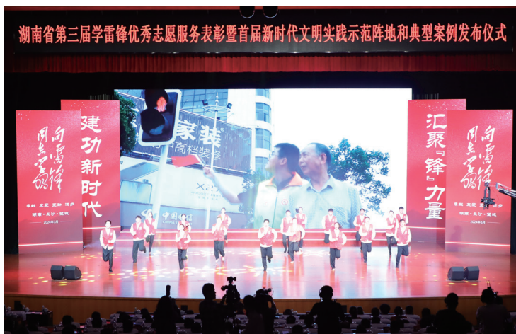
▲湖南省第三届学雷锋优秀志愿服务表彰

嵌入城市肌理。在城市规划建设管理中厚植雷锋元素，精心打造雷锋大道、雷锋公园、雷锋驿站、雷锋大剧