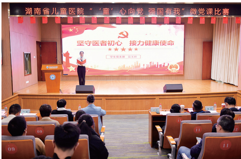
▲开展“‘童’心向党 强国有我”微党课比赛

正向赋能，筑牢思想引领根基。医院将深入开展思想政治工作融入学习贯彻习近平新时代中国特色社会主义思想中，融入学习理解掌握习近平总书记关于健康中国建设的重要论述中，制定并下发相关制度，如《中共湖南省儿童医院委员会“第一议题”学习制度》《湖南省儿童医院“一月一课一片一实践”制度》等，坚持和发