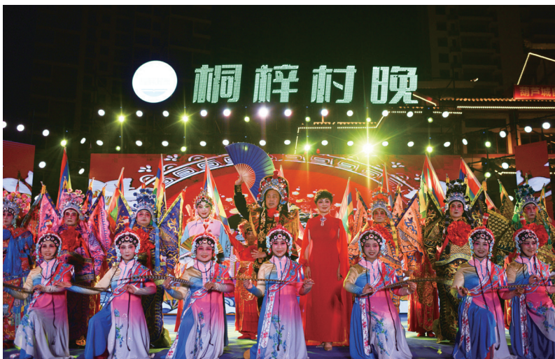
▲桐梓“村晚”启动现场

汇集资源，丰富旅游业态。桐梓县“村晚”持续围绕“吃、住、行、游、购、娱、康、体、研”等要素推动康养旅游一体化融合发展。推出“看‘村晚’、逛街景、品美食”旅游路线，将县内旅游景区串联起来，推出精品自驾游、乡村体验游、红色精品游、亲子研学游等“一日游、二日游、三日游”路线，不断丰富游客体验，促进旅游消费。借力“村晚”开展旅游服务提质行动，聚焦安全教育、服务方式、环境卫生等加强民宿从业人员培训，不断提升从业人员素质。提档升级乡村旅馆，全面提高管理服务水平，推动乡村旅馆规模持续壮大、经营持续规范、功能持续完善、品质持续提升。小西湖梅花鹿庄园荣获“贵州省十佳民宿”称号。全县评定三星级以上乡村旅馆240家，2024年新增乡村旅馆床位1万余张，累计接待游客1521.77万人次。