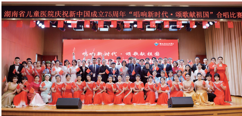
▲开展“唱响新时代·颂歌献祖国”合唱比赛

融入服务，方便群众。牢固树立人民至上、生命至上理念，聚焦影响人民健康的重大疾病和主要问题，全面提升防控和救治能力，发挥好国