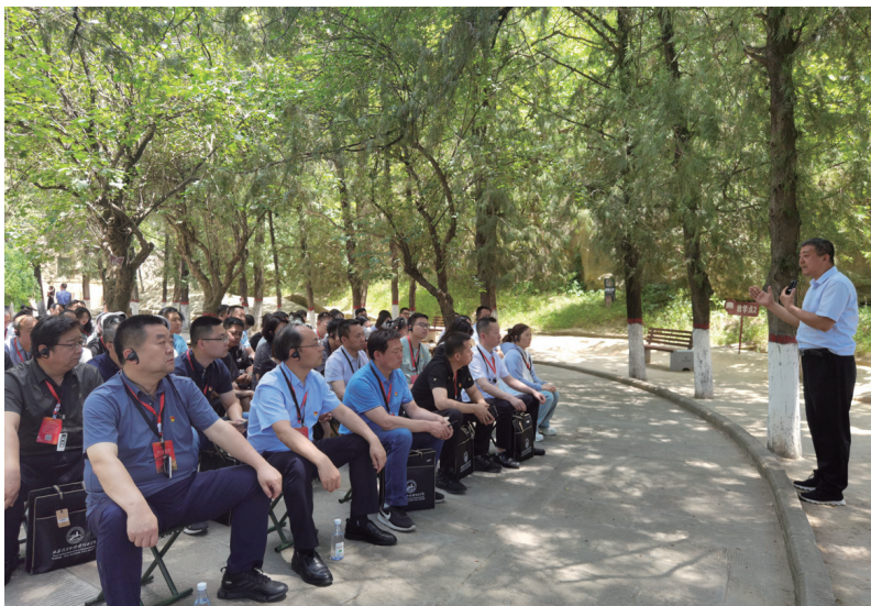
▲高级政工师培训班现场教学

工作，突出政治标准，加大实绩考察，印发《陕西省思想政治工作人员专业职务评定办法》，推动政工职称与其他职称享受同等待遇，激发政工干部工作的积极主动性。目前，共评定各级政工师30736名，其中，高级政工师9964名，正高级政工师177名，他们已成为全省企业思政工作的中坚力量。