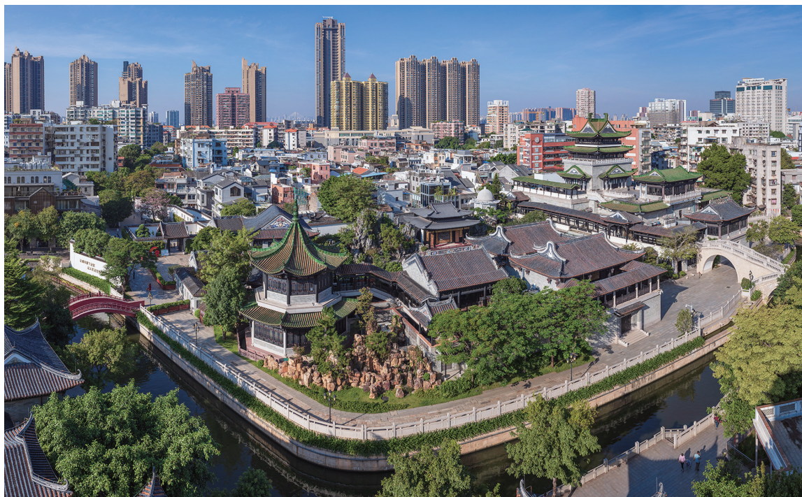
▲广州永庆坊粤剧艺术博物馆

岭南文化看广府，广府文化看西关。漫步永庆坊，脚下踩着麻石路，抬头望见满洲窗、绿釉瓷瓦片，耳边还不时传来叮叮当当的打铜声……随处都能感受到岭南传统文化所散发出的独特魅力，让人流连忘返。