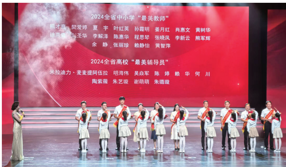
▲江西省举办庆祝第40个教师节文艺展演

“学习强国”江西学习平台等开设专题专栏，在江西新闻客户端推送开机屏海报。为进一步净化育人环境，省委宣传部会同省教育厅每年开展中小学校“最美教师”和高校“最美辅导员”推选宣传活动，促进师德师风建设日益向上向好。党的十八大以来，江西省共有7位教师获评全国教书育人楷模，4位教师获评全国“最美教师”，1位辅导员入选全国“最美高校辅导员”。为解决边远乡村缺医少药难题，组织“最美医生、最美护士”志愿服务队，深入乡村开展义诊巡诊、科普讲座等志愿服务活动，带动更多医务工作者将健康送到民众身边，让“最美医护”精神开花结果、“最美医护”故事芬芳远扬。三是先进典型与文艺创作相结合，做到典型宣传有“深度”。围绕全国道德模范、“最美奋斗者”称号获得者龚全珍，聚焦背后的点滴事迹和感人故事，组织创作歌曲《老阿姨》、电影《老阿姨》、电视剧《初心》、话剧《老阿姨》，编辑出版图书《共产党人龚全珍》《龚全珍日记选》《我和老伴甘祖昌》，发行邮册《共产党人——龚全珍》等。深挖江西省“时代楷模”事迹，推出报告文学《时代楷模·2020——江西省九江市消防救援支队》，拍摄电影《烈焰卫士》，通过艺术的形式，让先进典型融入群众日常、走进百姓心里。