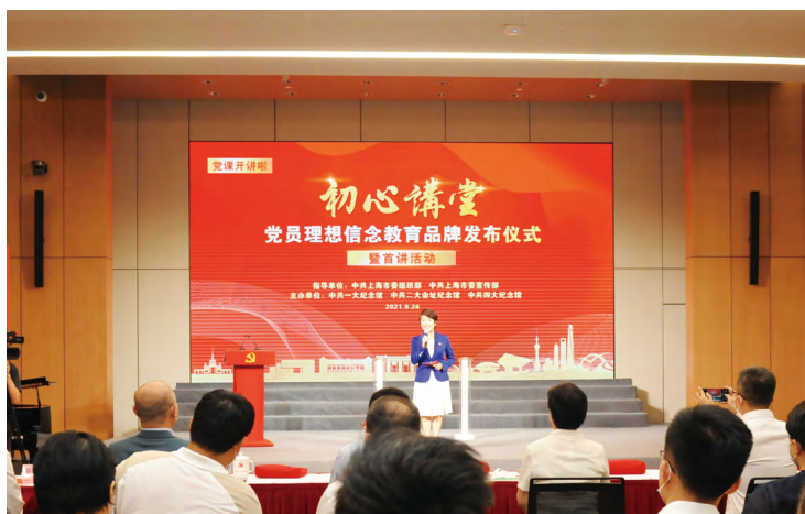
▲“初心讲堂”党员理想信念教育品牌发布仪式在中共一大纪念馆举行

《一号机密》等作品，并通过主创人员交流分享、相关党史知识讲述等方式，使党员“穿越”回当时的历史场景中，深切感悟上海作为“初心之地”的使命光荣。将课前重温入党誓词作为每次活动的必备环节，开展党员过“政治生日”等仪式教育。发挥上海“智慧党建”信息化平台作用，在“先锋上海”小程序开设专题专栏，推出在线预约、直播课堂、往期回顾三项功能，打造“初心讲堂”云端课堂。