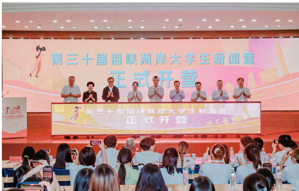
▲中国记协组织海峡两岸大学生新闻营

体改革的目标任务、重点和要求，对于更好塑造主流舆论新格局、巩固壮大主流思想舆论具有重要意义。全会闭幕后，中国记协积极谋划改革举措，解放思想、转变观念，破立并举、守正创新，坚持以改革牵引记协工作高质量发展，推动党的新闻舆论工作开创新局面。下一步，要以全会精神为指导，以互联网思维主导资源配置，持续深化拓展马克思主义新闻观教育，精心打造“记者之家”大学堂，做优网上平台，做实教育实践，丰富课程内容，创新培训形式，助推高水平采编人才培养，促进新闻界多出文章高手、主持大家、全媒尖兵、外宣能人。创新开展增强“四力”教育实践，组织开展有特色、有实效、有影响的教育培训、主题活动，引导新闻工作者心怀“国之大者”，坚守人民情怀、记录改革实践、讲好发展故事。持续推进“两奖”评选改革，优化奖项设置和评选机制，提升评奖工作科学化水平，更好发挥示范引领作用。改进创新“好记者讲好故事”活动，完善选拔标准和工作机制，注重选拔深入采编一线、富于改革创新精神的优秀新闻工作者，用亲历亲见亲为的好故事引导人、激励人。创新办好中国新媒体大会、