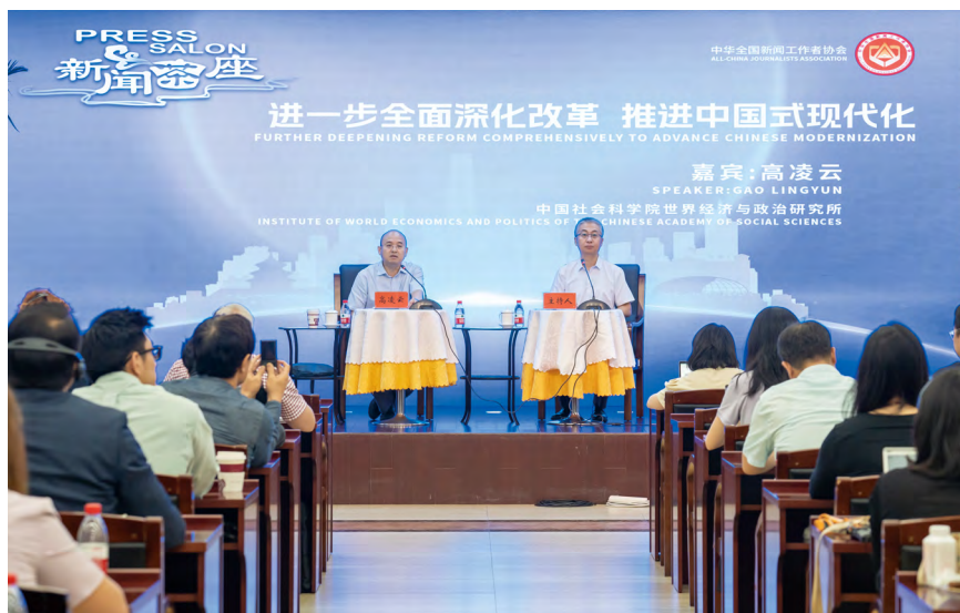
▲中国记协举办新闻茶座

在深化改革上坚定有力，助推媒体变革。 当前舆论生态格局发生深刻变化，全媒体传播态势加速演进，新闻舆论工作面临